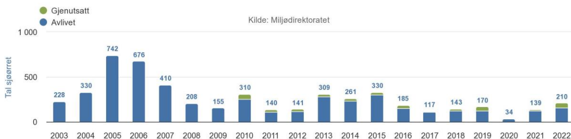
Figur 3. Rapportert fangst av sjøaure i Salvassdraget i perioden 2003-2022. Det er i de senere år skilt mellom avlivet (blå søyler) og gjenutsatt fisk (grønne søyler). Figuren er hentet fra lakseregisteret ( www.lakseregister.fylkesmannen.no ).