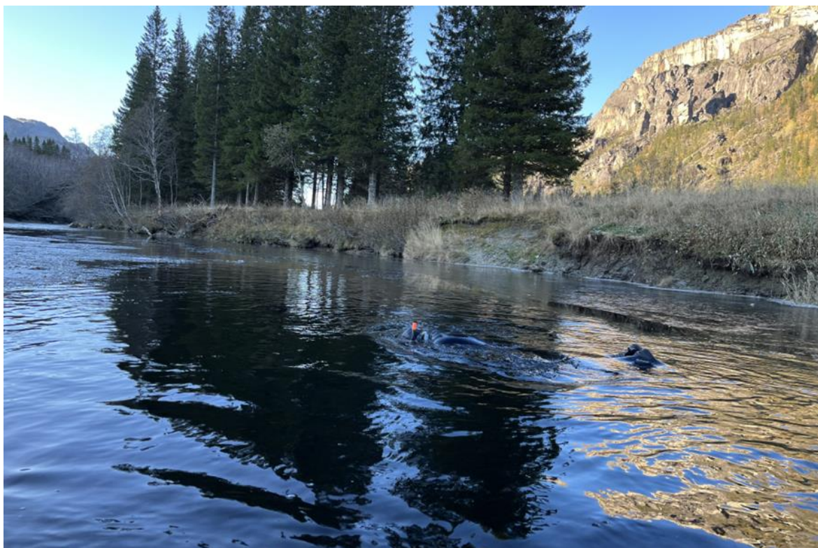
Bilde 5. Det ble gjennomført drivtelling på en isfri strekning i øvre deler av Skrøyvstadelva i oktober 2023.