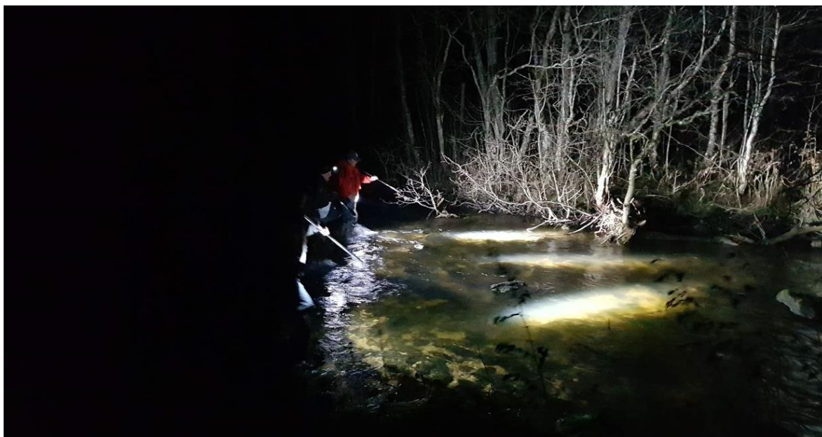
Bilde 1. Lysfiske utføres ved at tre eller flere personer vandrer oppover grunne elver og søker systematisk etter gytefisk.

I perioden 2014-2023 har det ved fem anledninger vært gjennomført lysfiske i indre deler av Salvassdraget. Under lysfisket har tre-fem personer gått systematisk oppover elvestrengen, og søkt etter gytefisk ved hjelp av hodelykter og lyssterke lykter ( bilde 1 ). Observerte gytefisk blir paralyisert ved å konsentrere lys mot fiskens hode ( bilde 2 ). Et utvalg fisk har blitt fanget i store knuteløse håver. Fiskene ble så overført til en bærebag for stor fisk (Hagala 1971) hvor hode og gjeller hele tiden var dekt av vann ( bilde 3 ). Fiskene ble artsbestemt, kjønnsbestemt og lengdemålt til nærmeste centimeter, og det ble tatt skjellprøver for senere analyser av opphav og livshistorie. Skjellene ble plukket ut med en nebbtang. Generelt sett er prøvene enklest å ta fra hunnfisk og fisk med blank gytedrakt ( bilde 4 ). Ut fra ytre karakterer ble det gjort en vurdering av antatt opphav, slik at eventuelle opplagte oppdrettsfisker kunne avlives. Etter prøvetaking ble fiskene satt ut på samme sted som de ble fanget.