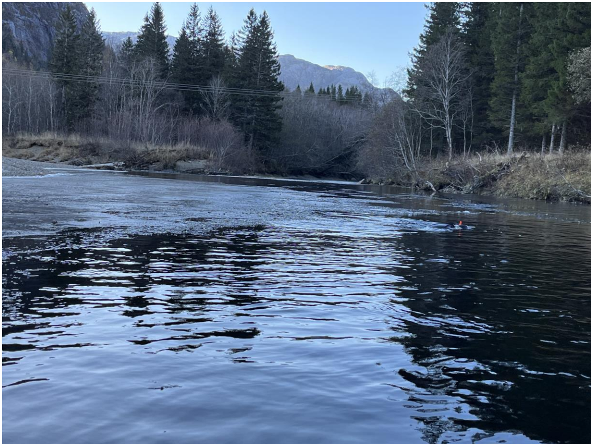
Bilde 9. På grunn av at det la seg et centimetertykt islokk på mesteparten av Skrøyvstadelva natta før drivtellinga, var det ikke praktisk gjennomførbart å undersøke mesteparten av den aktuelle elvestrekningen ned til Skrøyvstadvatnet.