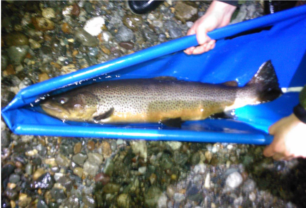
Bilde 6. En betydelig andel av sjøaurene i Salvassdraget blir storvokste flergangsgytere, slik som denne hannfisker på 77 centimeter og om lag seks kilo.