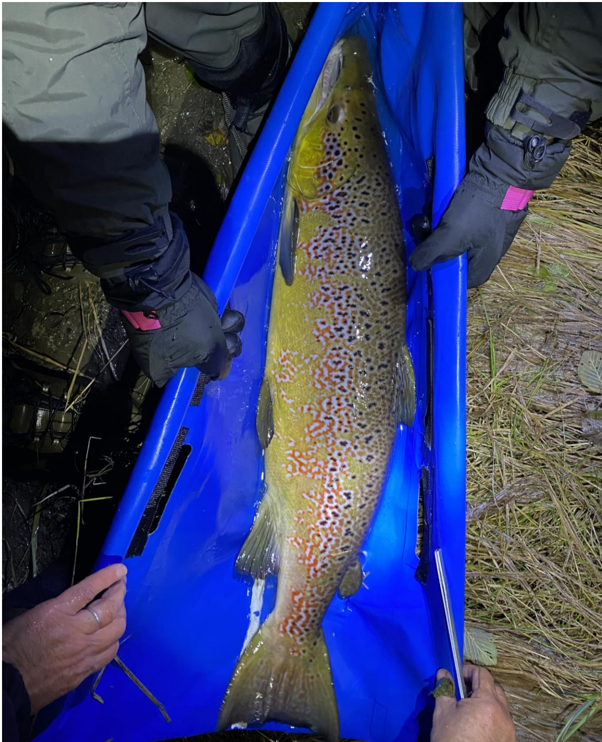
Bilde 8. Den største fisken som ble fanget under lysfiske i Kvernvasselve høsten 2023, var en hannlaks som målte 95 centimeter. Basert på den høye kondisjonsfaktoren veide fisken trolig i underkant av ti kilo.