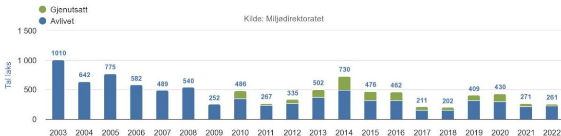
Figur 2. Rapportert fangst av laks i Salvassdraget i perioden 2003-2022. Det er i de senere år skilt mellom avlivet (blå søyler) og gjenutsatt fisk (grønne søyler). Figuren er hentet fra lakseregisteret ( www.lakseregister.fylkesmannen.no ).

Ifølge offisiell statistikk blir det fanget mer laks enn sjøaure i Salvassdraget. I perioden 2003-2022 er det rapportert årlige fangster på 202-1010 laks ( figur 2 ), mens det i samme periode er rapportert årlige fangster på 34-742 sjøaure ( figur 3 ). Imidlertid er det klare indikasjoner på underreportering fra fritidsfisket i de større vannene, siden dette er et åpent fiske med mange aktører uten tilstrekkelig kunnskap om rapporteringsrutiner. Omfanget på denne underreporteringen er trolig betydelig, og det kan også stilles spørsmål ved presisjonen på opplysningene i den offisielle fangststatistikken. Som eksempel på dette er det samlede antall registrerte sjøaurer i fiskesesongen 2020 alt for lavt (34 individer), siden forfatterne selv har rapportert inn større fangster (60 individer) via det elektroniske rapporteringssystemet til Firma Albert Collett.