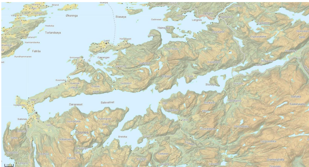
Figur 1. Kart over Salvassdraget i Ytre Namdalen. De undersøkte elvene Kvernvasselva og Skrøyvstadelva drener til Skrøyvstadvatnet i indre deler av vassdraget.

Salvassdraget er lokalisert i nordre del av Trøndelag og har et samlet nedbørsfelt på 433 km 2 . Nedbørsfeltet ligger i Namsos, Nærøysund, Høylandet og Overhalla kommuner. Nedre deler av vassdraget består av en rekke vann med mellomliggende elvestrekninger, og samlet innsjøareal i nedbørsfeltet er om lag 14 % ( www.nve.no ). Øvre deler av vassdraget består av fjellbekker og mindre elver som drenerer til større elver og vann, som igjen drenerer til Salvatnet og utløpselva Moelva. Salvatnet er om lag 22 kilometer langt, har et overflateareal på 44 km 2 , og er Europas nest dypeste innsjø med maksimal dybde på 464 meter. Salvatnet er en såkalt miromiktisk innsjø, og har et bunnlag med gammelt, stagnerende sjøvann (Bøyum 1973). Nyere undersøkelser viser at de dypeste områdene har oksygenvinn og inneholder hydrogensulfid, slik at det ikke finnes grunnlag for vannlevende organismer dypere enn om lag 400 meter (Lyche Solheim et al. 2021).