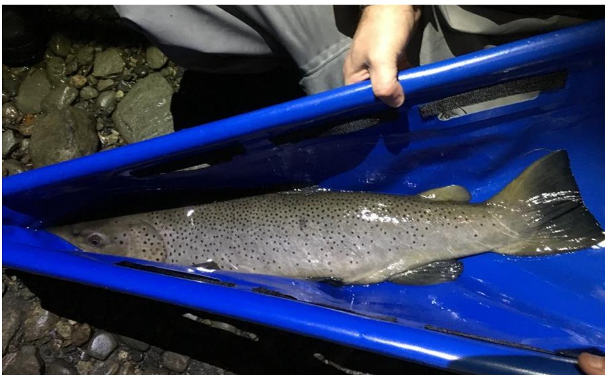
Bilde 4. Ofte er det lettest å ta skjellprøver av hunnfisk og fisker med blank gytedrakt. Illustrasjonsbildet er av en blank hannfisk av sjøaure som målte 75 centimeter.