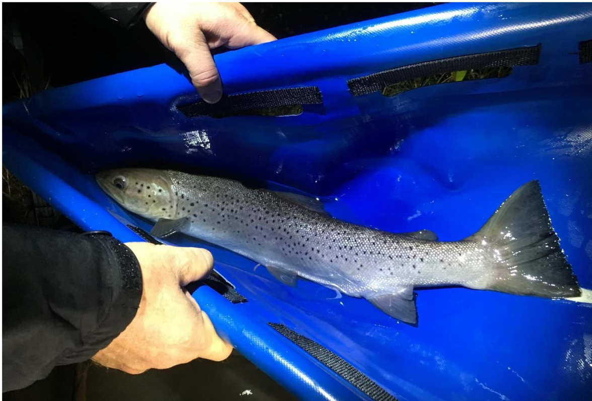
Bilde 3. Etter fangst blir fiskene overført til en stor bærebag, der både hode og framkropp er dekt av vann. Illustrasjonsbildet er av en utgytt hunnfisk av sjøaure.