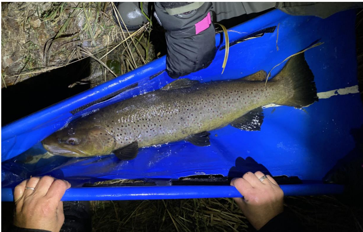
Bilde 7. Den største sjøauren som ble fanget under lysfiske i Kvernvasseelva høsten 2023, var en hannfisker på 77 centimeter.