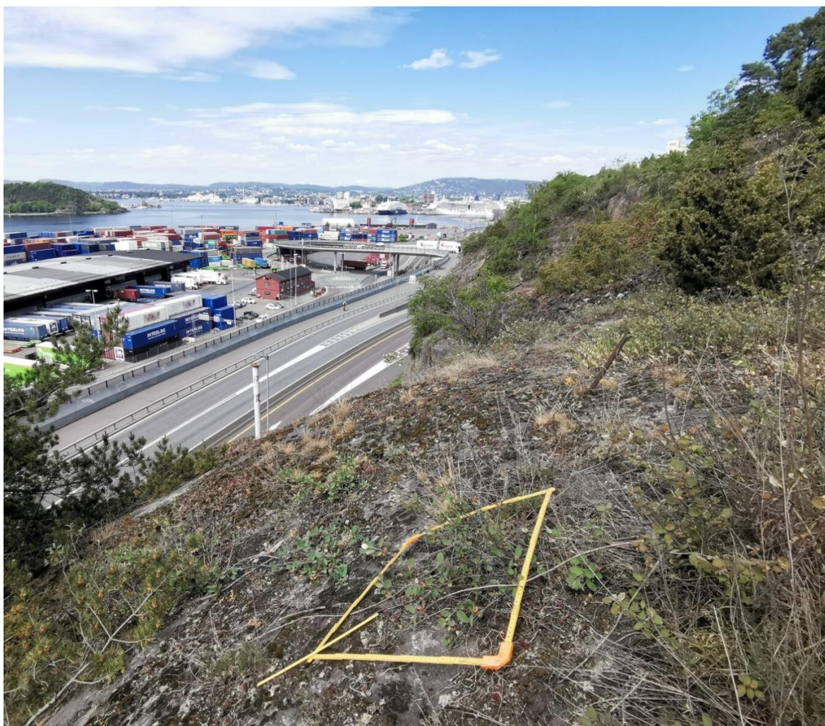
Figur 1. Åpen grunnlendt kalkmark på Ekebergskråningen, Oslo.

Åpen grunnlendt kalkmark i boreonemoral sone er vurdert å være en sterkt truet naturtype (EN) (Evju et al. 2018a). De viktigste truslene mot åpen grunnlendt kalkmark er fremmede arter, nedbygging, slitasje og gjengroing ( Figur 2 ). Naturtypen er rødlistet både på grunn av historisk og pågående arealtap, og derfor reduksjon i naturtypeareal, men også tilstand i kombinasjon med en begrenset utbredelses- og forekomstareal (Evju et al. 2018). I desember 2020 fikk naturtypen status som utvalgt naturtype ( Forskrift om utvalgte naturtyper etter naturmangfoldloven - Lovdata ).