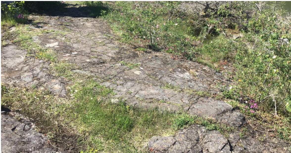
Figur 2. Slitasje på grunn av ferdsel er en trussel mot åpen grunnlendt kalkmark.

For å ivareta åpen grunnlendt kalkmark og hindre ytterligere arealtap og tilstandsreduksjon er det behov for kunnskap om naturtypen. Overvåking startet i 2020 (Evju et al. 2020) og i denne rapporten presenteres gjennomførte aktiviteter og overordnede resultater fra 2023.