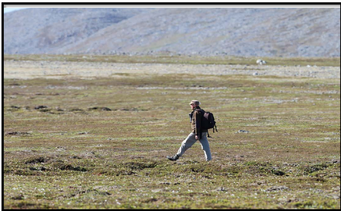
Figur 9. I 2012 ble det ved en rekke anledninger registrert turister som gikk i lengre tid inne i de viktigste hekkeområdene for å fotografere fugl. Denne adferden resulterte i store forstyrrelser og er ikke gunstig for fuglelivet i naturreservatet. Denne personen oppholdt seg mer enn en time i det samme området.

Også i 2012 ble det registrert en del uheldig trafikk av turister. Ved flere tilfeller ble det sett personer med fotoutstyr som over lengre tid gikk fram og tilbake i de viktigste hekkeområdene og holdt med dette de fleste rugende vekk fra egg eller små unger (Figur 9). Denne type menneskelig forstyrrelse er økende på i naturreservatet på Slettnes. Den påviste reduksjonen av hekkende fugl i veinære områder skyldes sannsynligvis økningen i slik adferd.