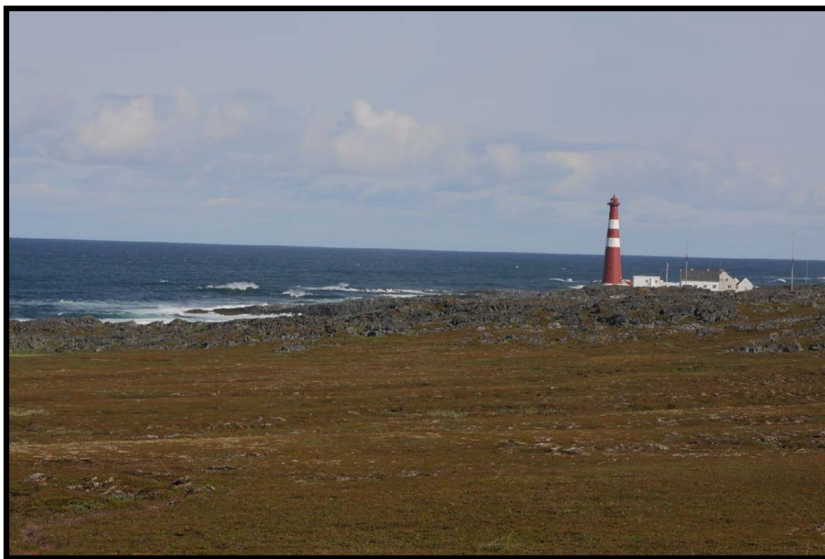
Slettnes fyr er et markert innslag i landskapsbildet i Slettnes naturreservat.