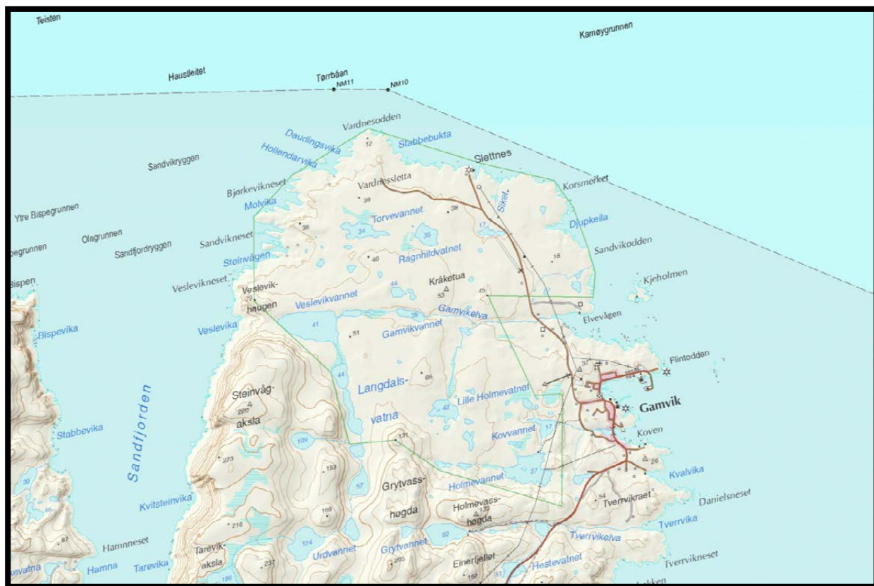
Figur 1. Slettnes naturreservat ligger helt nordøst på Nordkinnhalvøya i Gamvik kommune.

I de rikeste myrdragene og senkninger i terrenget der landskapet er mindre eksponert for vær og vind, vokser det stedvis vierkratt, ellers er det kortvokst vegetasjon som preger landskapet. Større trær finnes ikke. Betydelige deler av arealet har lite eller kun flekkvis vegetasjon utover lav og moser. Noen av de mest dominerende plantene er fjellsmelle, rødsildre, reinrose, ulike arter starr og lyng, moser og lav. Langs bekkesigene vokser det tette bestander med sibirgressløk. I tillegg vokser den meterhøye nyserota over store deler av Slettnes. Denne storvokste arten som tilhører giftliljefamilien skiller seg ut fra resten av vegetasjonen i området ved at den blir opp til en meter høy.