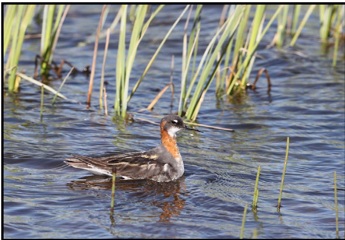
Figur 6. Svømmesnipe hekker en rekke steder på Slettnes.

Svømmesnipe er en vanlig art over hele Slettnes. Den hekker i alle områder med rik vegetasjon i tilknytning til vann og tjern. Arten varierer noe i antall mellom de ulike årene, men normalt ligger hekkebestanden et sted mellom 30 og 50 reir. Ettersom det kun er hannene som ruger og en hunnen legger flere kull med ulike hanner (polyandrisk), oppgir vi antall reir og ikke par som for de andre artene. I 2012 ble det funnet 15 reir, men vi anslår det totale antall reir til å ligge på rundt 30.