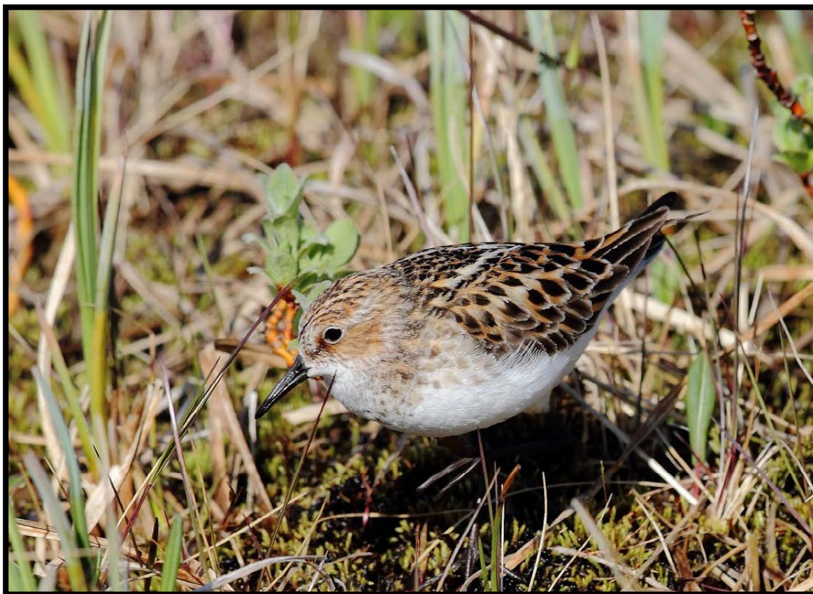
Figur 4. Det hekket minimum 12 par med dvergsniper på Slettnes i 2012.

sjonsfattige delene inne mot Gamvikvasshøgda. Ett individ ble påvist i reservatet i 2012.