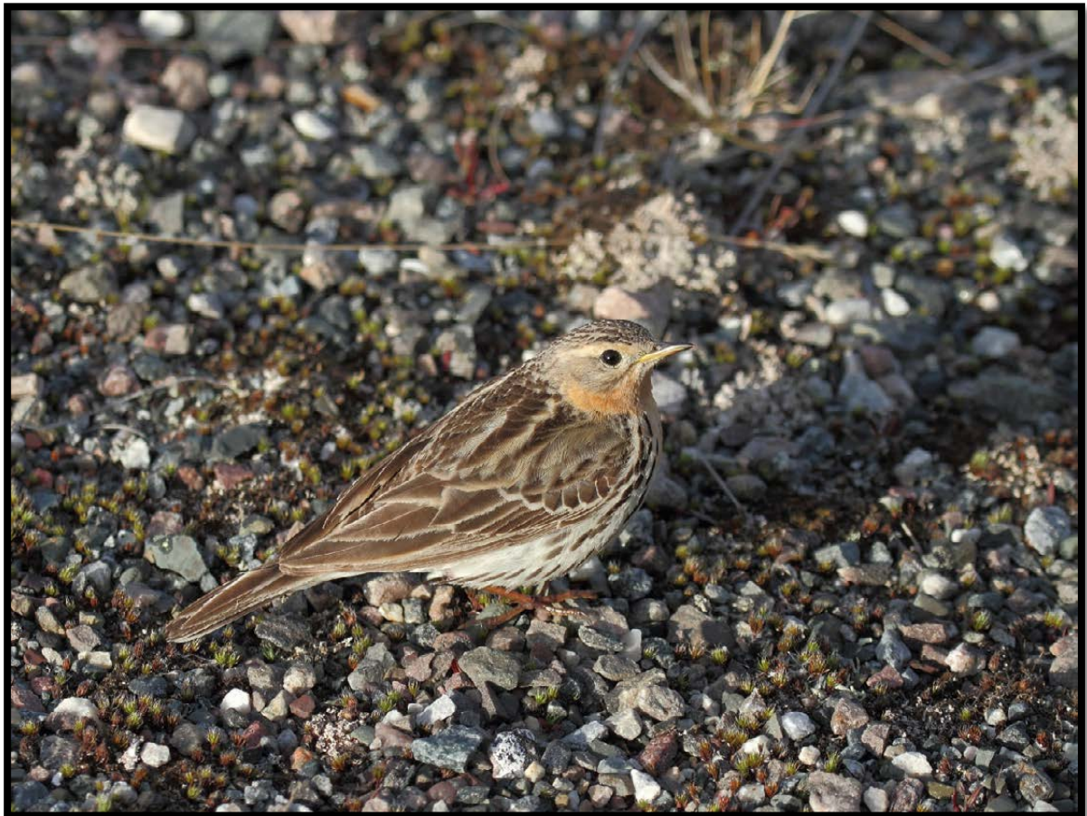
Figur 7. Lappiplerke er en vanlig hekkefugl de lavereliggende delene av Slettnes naturreservat.

Lappiplerka er sammen med heiplerka noen av de mest vanlige og typiske spurvefuglene for Slettnes. Våre resultater tyder på at det fremdeles hekker rundt 40 par lappiplerker i området, de fleste i de mer vegetasjonsrike delene.