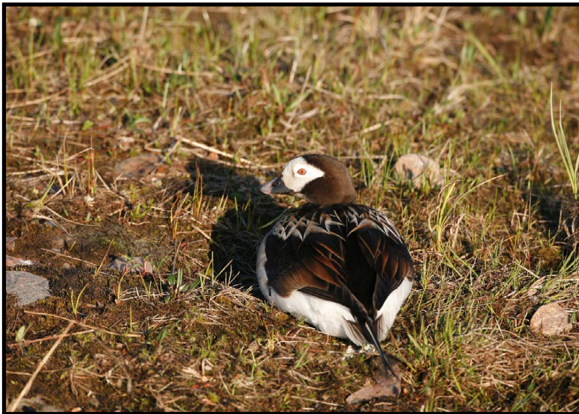
Figur 3. Havella er en vanlig hekkefugl i hele Slettnes naturreservat.