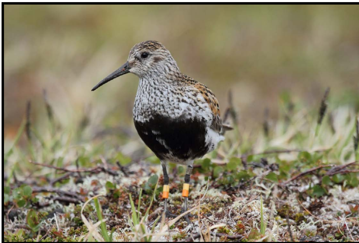
Figur 5. Voksne myrsniper som hekker på Slettnes er fargemerket.