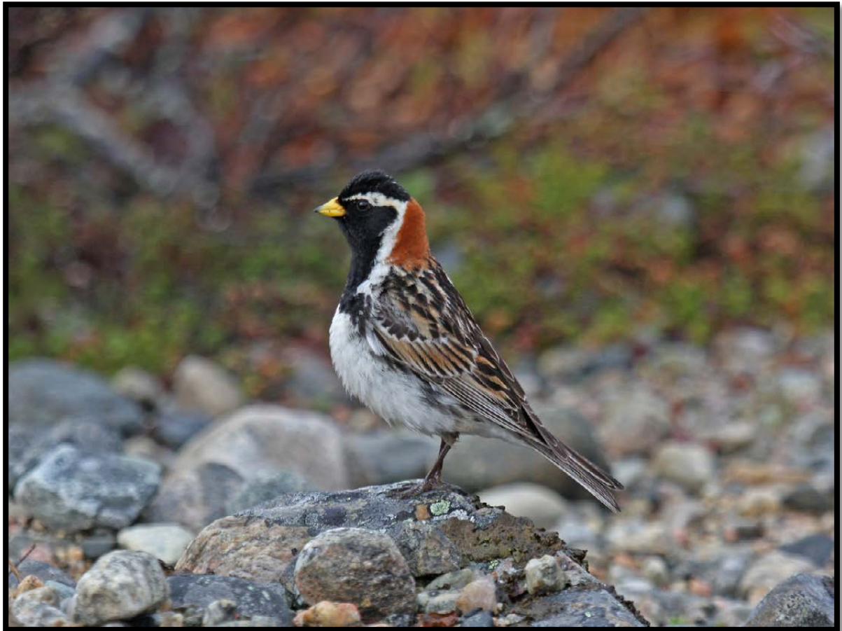
Figur 8. Lappspurven er vanlig i de tørrere myrpartiene i Slettnes naturreservat. Her lappspurv hann.