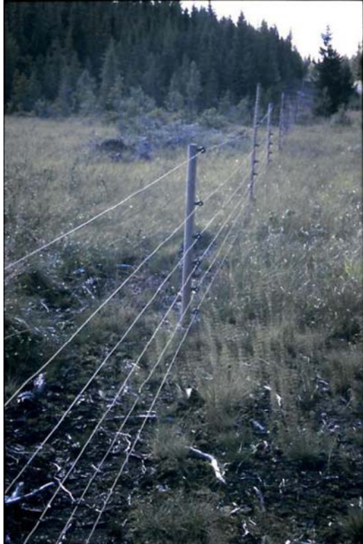
Figur 1a Elektrisk strekkgjærde med seks tråder