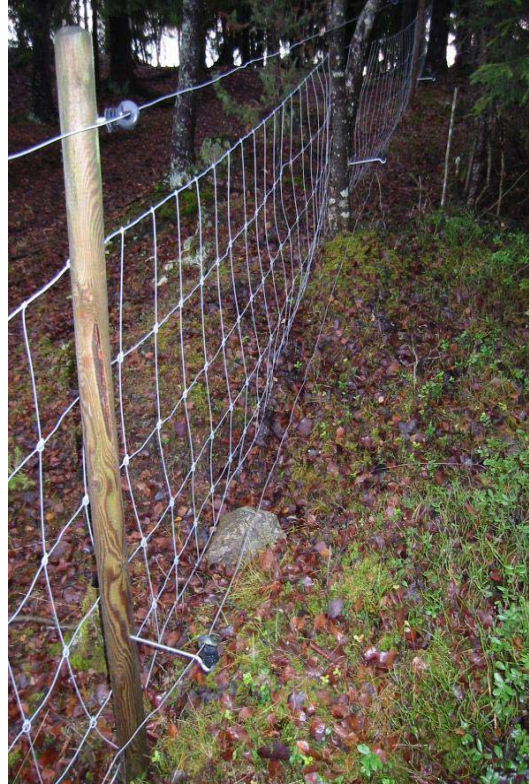
Figur 1b Utbedret sauegjærde m/to strømråder

Det påpekes videre i standarden at gjærdet skal tilpasses den enkelte rovdyrart, og i tilfeller hvor en har forekomst av alle fire rovdyr skal gjærdet dimensjoneres etter den art som er vanskeligst å sperre ute. Anbefalte trådavstander og gjærde typer for de forskjellige rovdyrartene er gjengitt i tabell 1 nedenfor: