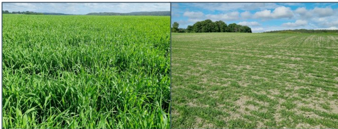
Figur 1. Figuren viser en kornåker i vekstfase fotografert 22. juni (2022) i Fredrikstad. De to bildene viser samme areal, men bildet til høyre illustrerer hvordan gjessene har beitet ned vekstene på den delen som ligger nærmest fuglereservatet og som ligger side om side med kornåkeren.

I Viken fylke kan grunneiere, som er utfordret med beitende gjess på landbruksarealene og ellers fyller vilkårene over, søke kommunen om skadefelling både av grågås og hvitkinngås. I fylket er det mange store matprodusenter med store verdier på arealene. De økende gåsebestandene som både hekker og raster i regionen gjør det utfordrende å praktisere en bærekraftig matproduksjon (Holmgaard 2022). I Fredrikstad kommune er det flere grunneiere som søker om skadefelling av gjess, som en siste utvei for å begrense skadeomfanget. Arealer som ligger nært fuglereservatene er ekstra utsatt, da gjessene kommer inn fra verneområdene og beiter seg innover på marka ( Figur 1 ).