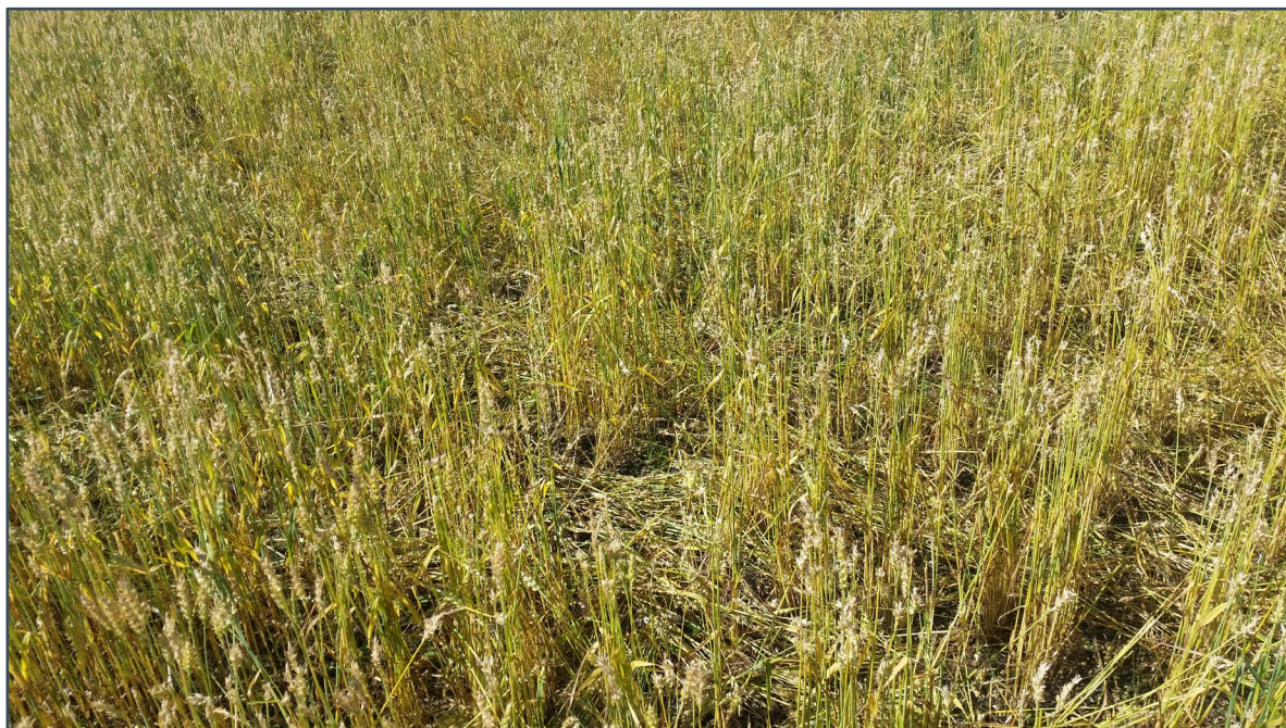
Figur 4. Eksempel på hva som kan skje med en kornåker om en ikke klarer å holde gjessene unna. Bildet viser en nedbeitet kornåker i Oslofjordområdet der grågjess både har spist av stående (uhøstet) aks og trampet ned vekstene.

Resultatene fra dette forsøket viser at skadefelling som tiltak for å jage bort gjess fra et sårbart landbruksareal, og begrense beiteskadene ( Figur 4 ), kan være svært effektivt selv om det også vil kreve noe innsats. Av praktiske årsaker var det kun mulig å gjennomføre prosjektet hos én grunneier i Fredrikstad i 2022. Dette er imidlertid en viktig matprodusent med en eiendom som har en strategisk beliggenhet i forhold til gåseproblematikken. Gården ligger nært naturreservat og hvileområde for gjess, har årlig mange gjess, lang historikk med gåseutfordringer på sårbare landbruksarealer, samt har en løsningsorientert grunneier. Vi antar derfor, til tross for at dette er et forsøk på kun ett areal, at resultatene er overførbare til andre områder med tilsvarende utfordringer.