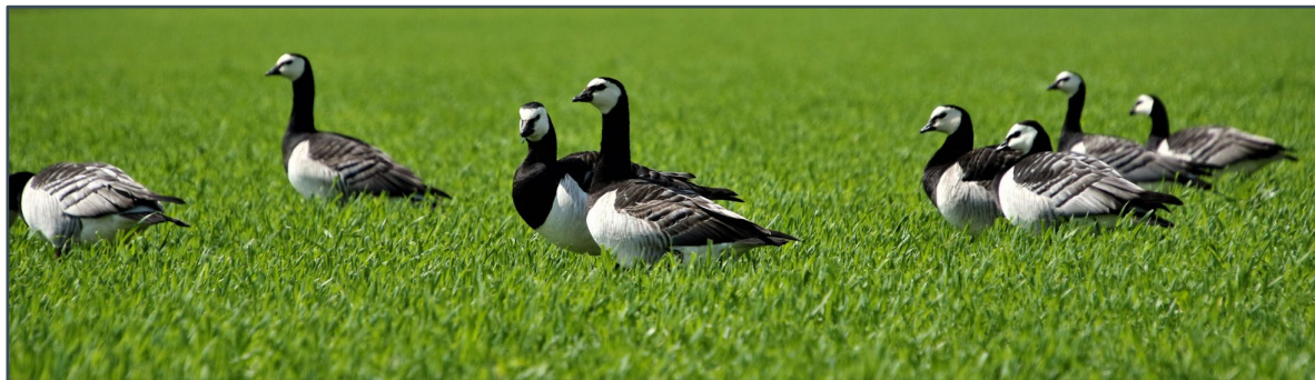
Figur 3. Hvitkinngjess på landbruksarealer i Sør-Norge.