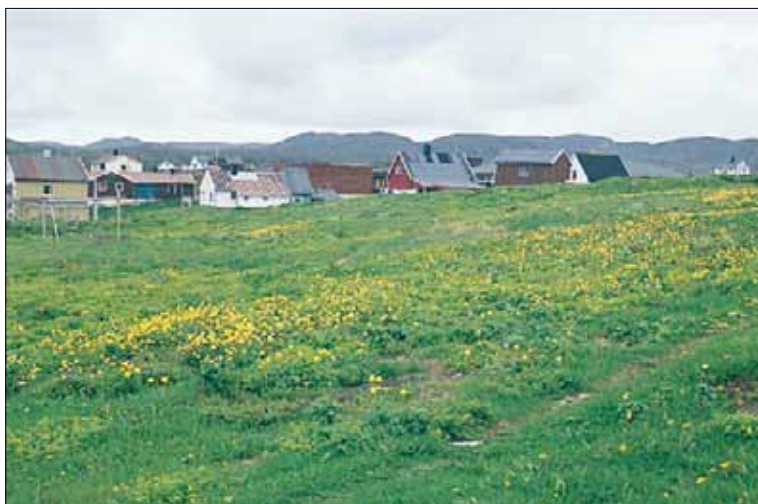
G13 Frisk, næringsrik «natureng», her med marikåpe-arter Alchemilla spp., skogstorkenebb Geranium sylvaticum og ballblom Trollius europaeus . Finnmark, Gamvik, Gamvik, 1992. Hemiarktisk (Moen 1998), O1.