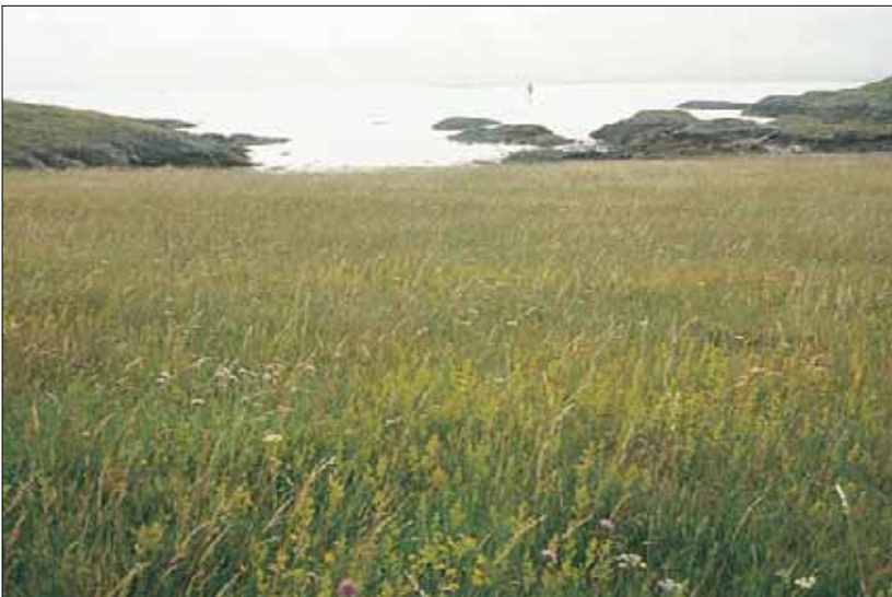
G10 Hestehavre-eng: her på skjellsand, med hestehavre Arrhenatherum elatius , gulmaure Galium verum , rødknapp Knautia arvensis og gjeldkarve Pimpinella saxifraga . Sør-Trøndelag, Bjugn, Asenøy, 1988. SB, O3.

Referanser - Marker (1969), Lundberg (1987), Kielland-Lund et al. (1993), egne observ., R. Elven, pers. medd.