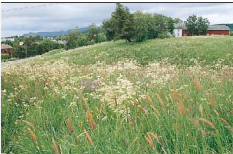
G14 Frisk, næringsrik «gammeleng»: her forsommeraspektet til et forfallstadium med hundekjeks Anthriscus sylvestris og engreverumpe Alopecurus pratensis . Sensommeraspektet har bl.a. mye mjødukt Filipendula ulmaria og sibirbjønnekjeks Heracleum sibiricum . Sør-Trøndelag, Trondheim, Moholtdalen, 1990. SB, O1.