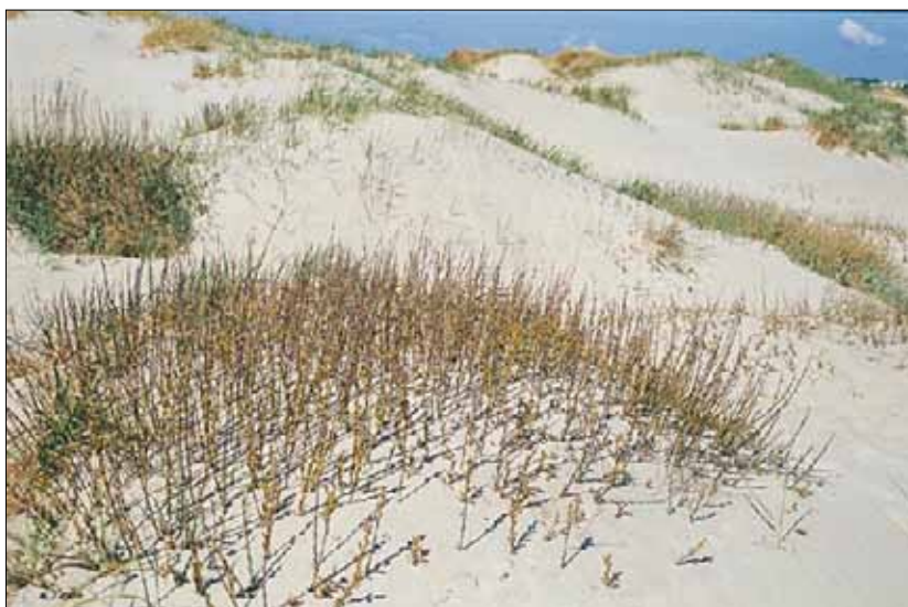
V7d Primærdyne, sandvier-utforming: flyvesand som stabiliseres av Salix repens var. nitida bakenfor V7a primærdyne, marehalm-utforming, med marehalm Ammophila arenaria . Rogaland, Sola, Solasanden, 1991. BN, O3.