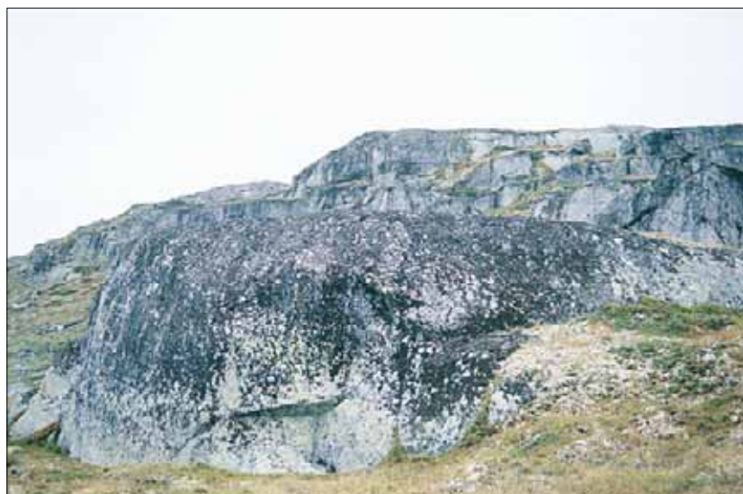
R7 Epilittisk lav-vegetasjon: kan enkelte steder dekke betydelige arealer, enten på bergvegger eller i blokkmark. Hordaland, Ulvik, Finse, 1995. LA, OI.

R7c Bladlav-dvergbusklav-utforming. Med Parmelia - Arctoparmelia -samfunnene, steinskjegg- Pseudophebe -samfunnet og rabbelav- Brodoa -samfunnet. På steiner og berg med noe finmateriale, basefattig.