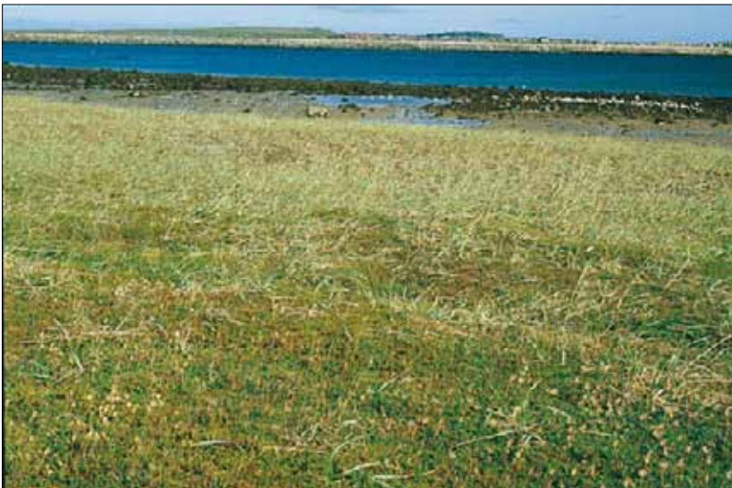
W2c Dyneeng og dynehei, reinrose-utforming: stabilisert flyesand med sluttet feltsjikt der strandrug Leymus arenarius , krekling Empetrum nigrum coll. og reinrose Dryas octopetala dominerer. Finnmark, Vardø, Svartnes, 1983. NB, OC.