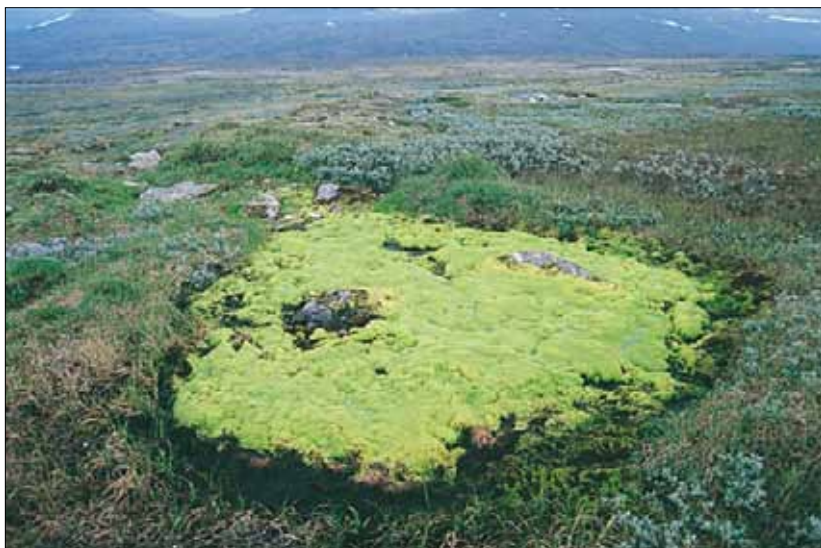
N1c Fattigkilde, kildemose-kaldnikke-utforming: her dominert av kaldnikke Pohlia wahlenbergii ; av karplanter inngår bare litt brearve Cerastium cerastoides . Oppland, Dovre, NV Hjerkin, 1994. LA, OC.