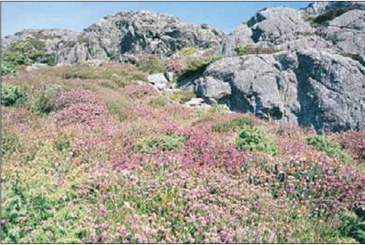
H1b Tørr lynghei, purpurlyng-utforming: med røsslyng Calluna vulgaris , purpurlyng Erica cinerea og klokkelyg Erica tetralix i blomst. Rogaland, Karmøy, Peradalen, 1995. BN, O3.