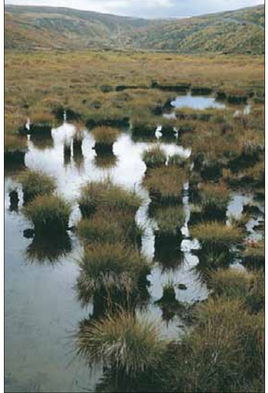
O3d Elvesnelle-starr-sump, stolpestarr-utforming: lite bestand av stolpestarr Carex nigra ssp. juncella , sent i sesongen. Oppland, Dovre, Grimsdalen, 1984. NB, OC.

O3d Stolpestarr-utforming Bestand dominert av stortuet stolpestarr Carex nigra ssp. juncella , i grunne sumper med store vekslinger i vannstand. Oligotroft-mesotroft. Østlig. SB-NB, O1-C1.