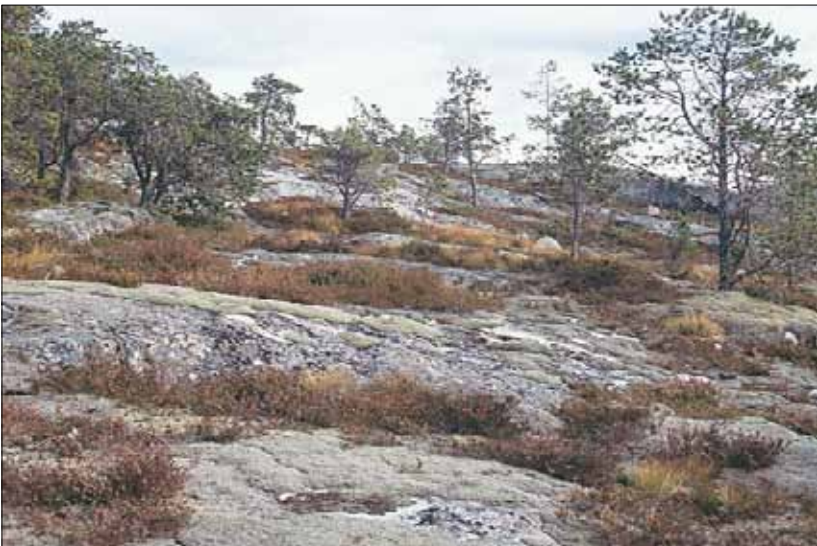
A6d Knausskog, humid utforming: åpne bestand av furu Pinus sylvestris med røsslyng Calluna vulgaris , småbjønnskjegg Trichophorum cespitosum ssp. cespitosum og heigråmose Racomitrium lanuginosum . Nordland, Ballangen, Forså-Kjerringvik, 1992. MB, O2.

A6c rabbesigd Dicranum spurium mk blåmose Leucobryum glaucum m einerbjørnemose Polytrichum juniperinum