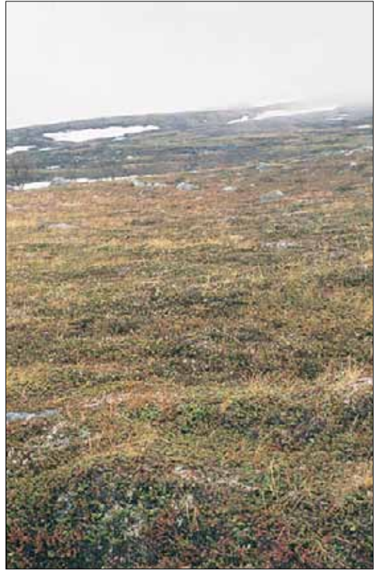
R4b Reinrose-kantlyng-moserabb, kantlyng-utforming: tidlig i sesongen med kantlyng Cassiope tetragona i blomst. Troms, Målselv, Dividalen under Litle Hierta, 1993. LA, C1.

Arter - Typen inneholder mange "trivielle" arter fra fattige, moderate rabbesamfunn og lesidesamfunn i tillegg til de som anføres her. Den har også mange arter felles med R3.