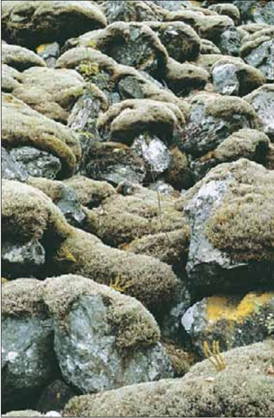
F1d Rasmark, heigråmose-utforming: utsnitt av rasmark der heigråmose Racomitrium lanuginosum er viktigste art og lusegras Huperzia selago ssp. selago står spredt på tuene. Aust-Agder, Evje og Hornnes, Stavedalen, 1992. SB, O2.

I gruppene F, G, H og I beskrives fastmarksvegetasjon som er uten tresetting, iallfall når de er optimalt utviklet og ikke i et stadium av gjengroing. Gruppene har hovedtyngde i lavlandet (jf gruppene i fjellet, R-T), men en del typer er spesifikke for høyere liggende områder. I F finnes både naturlige (ikke kulturbetingete) og kulturbetingete eller kulturpåvirkete typer. Vegetasjonstypene i G, H og I er kulturbetingete.