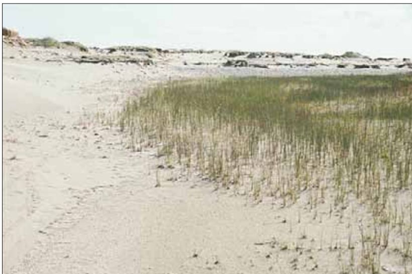
W4a Dynetrau, siv-utforming: her preget av finnmarkssiv Juncus arcticus ssp. arcticus . Finnmark, Vadsø, Skallelv, 1983. NB, OC.

W4b Takrør/smårørkvein-utforming . Høyere feltsjikt av grasarter. Bunnsjikt av pleurokarpe moser. Tørker ut senere på sommeren enn W3a. Kjent nord til Vesterålen. N-MB.