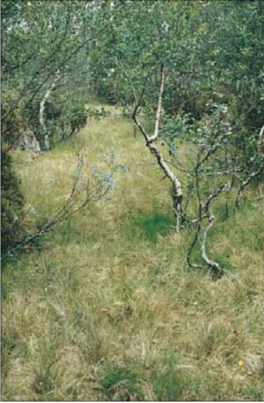
A7a Grasdøminert fattigskog, finnskjeegg-utforming: med fjellbjørk Betula pubescens ssp. czerepanovii , lappvier Salix lapponum og finnskjeegg Nardus stricta . Sør-Trøndelag, Røros, Brekken, 1983. NB, OC.