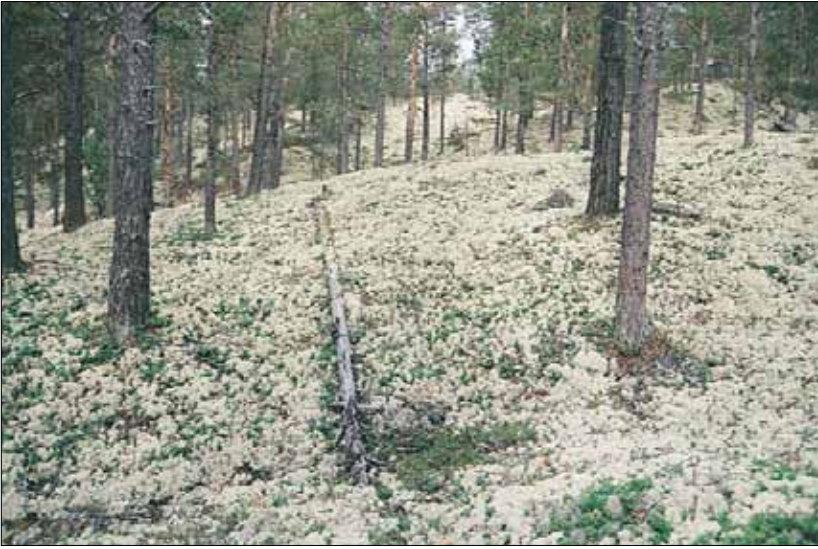
A1a Lavskog, lav-furu-utfoming: i sin reneste utfoming med hvitkrull Cladonia stellaris og tyttebær Vaccinium vitis-idaea . Hedmark, Follidal, NV Straumbu, 1995. MB, CI.