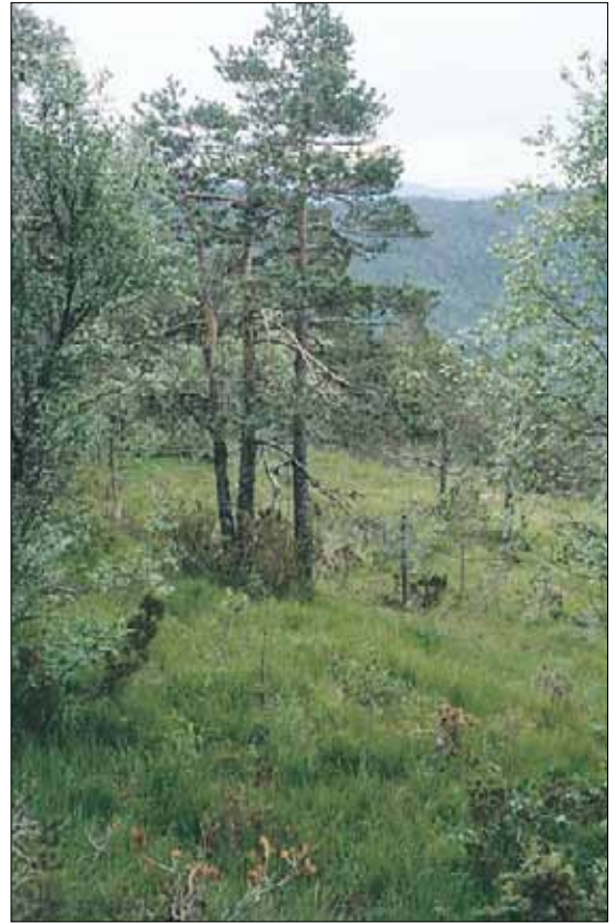
A7c Grasdøminert fattigskog, blåtopp-utforming: bestand av furu Pinus sylvestris og dunbjørk Betula pubescens ssp. pubescens , med blåtopp Molinia caerulea i bunnen. Hordaland, Kvam, under Vesoldo, 1981. MB, O3.

jord eller humuspodsol, pH 4,0-4,5, høyt glødetap. Blåtoppskoger varierer i artsammensetning, fra utforminger beslektet med fattig sumpskog (E1), til blåbærskog (A4) og lavurtskog (B1). Artsliste gis derfor ikke for utformingen. BN-NB, O3-O1.