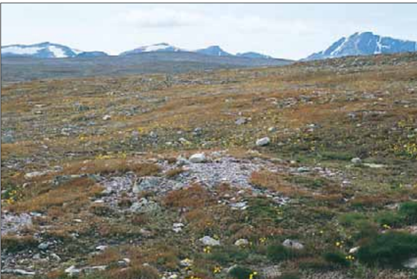
R5 Grasrabb, rabbesiv-utforming: svært tidlig utsmeltende hei med rabbesiv Juncus trifidus og fjellsveve Hieracium alpinum . Oppland, Dovre, nær Snøhetta. MA, O1.

Arter stivstarr Carex bigelowii sauevingel Festuca ovina fjellsveve Hieracium alpinum rabbesiv Juncus trifidus aksfrytle Luzula spicata musøre Salix herbacea gullris Solidago virgaurea tyttebær Vaccinium vitis-idaea