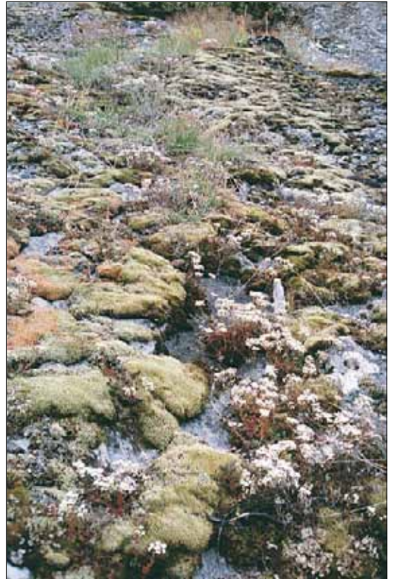
F3b Bergknaus og bergflate, bakkemynte-hvitbergknapp-utforming; moserikt berg med hvitbergknapp Sedum album . Oppland, Lom, Galdesand, 1985. MB, OC.

Referanser - Sunding (1965), Marker (1969), Halvorsen (1980), egne observ.