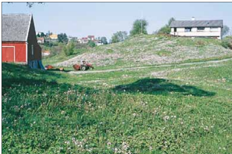
G12b Våt/fuktig, middels næringsrik eng, engkarse-krypsoleie-utforming: med engkarse Cardamine pratensis ssp. pratensis og krypsoleie Ranunculus repens . Hordaland, Bergen, Apeltun, 1994. BN, O3.