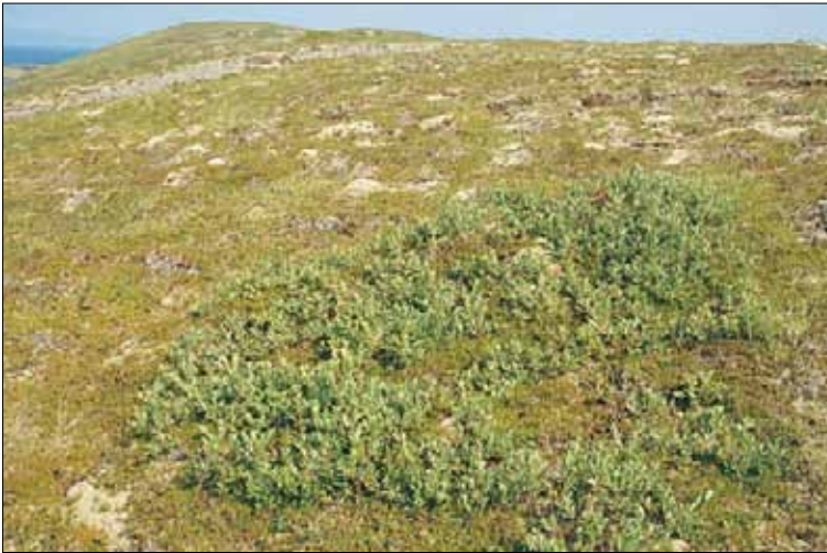
H1e Tørr lynghei, røsslyng-heigråmose-lav-utforming: med røsslyng Calluna vulgaris , krekling Empetrum nigrum coll. og heigråmose Racomitrium lanuginosum , og ørevier Salix aurita , her et tegn på begynnende gjengroing. Sør-Trøndelag, Bjugn, Asenøy, 1988. SB, O3.

m bråtestarr Carex pilulifera vanlig arve Cerastium fontanum ssp. vulgare skrubbeær Cornus suecica flekkmarhånd Dactylorhiza maculata knegras Danthonia decumbens smyle Deschampsia flexuosa krekling Empetrum nigrum coll. lyngøyentrøst Euphrasia micrantha rødsvingel Festuca rubra ssp. rubra geitsvingel Festuca vivipara hårsveve Hieracium pilosella kystgriseøre Hypochoeris maculata tiriltunge Lotus corniculatus markfrytle Luzula campestris engfrytle Luzula multiflora ssp. multiflora hårfrytle Luzula pilosa stormarimjelle Melampyrum pratense