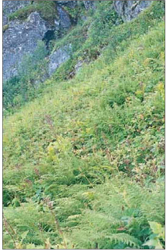
C2a Høystaudebjørkeskog: skog av fjellbjørk Betula pubescens ssp. czerepanovii med tyrihjelms Acontium septentrionale , mjøduert Filipendula ulmaria og skogrørkvein Calamagrostis purpurea som særlig viktige arter. Sør-Trøndelag, Røros, Røvollen i Femundsmarka, 1987. NB, OC.