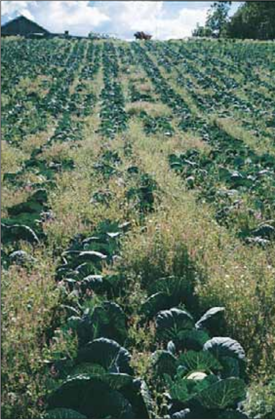
I4a Ugrasvegetasjon på dyrket mark, utforming mest av ettårige arter. Kålåker med jordrøyk Fumaria officinalis og åkersvineblom Senecio vulgaris . Nord-Trøndelag, Frosta, Tautra, 1988. SB, O1.