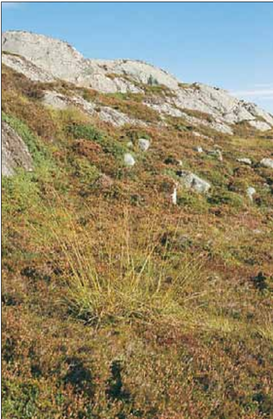
H1a Tørr lynghei, røsslyng-utforming: sørvendt skråning med røsslyng Calluna vulgaris og mjølbær Arctostaphylos uva-ursi , og heistarr Carex binervis i forgrunnen. Sør-Trøndelag, Hitra, Gjøsoya, 1988. SB, O3.

Referanser - Nordhagen (1917), Skogen (1965, 1971), Kristiansen (1975a), Øvstedal (1985), Fremstad et al. (1991), Skogen & Odland (1991).