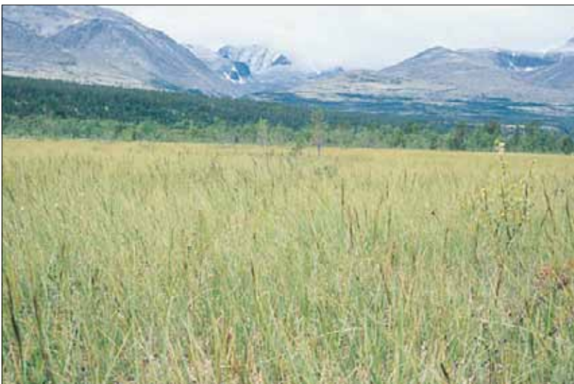
L4c Høystarrmyr, nordlandstarr-utforming: flatmyr med nordlandstarr Carex aquatilis . Hedmark, Stor-Elvdal, Atnsjømyrene, 1995. NB, C1.

Sosiologisk tilknytning - L4a: Caricion lasiocarpae. L4b-c: Magnocaricion p.p. Se også O3-4.