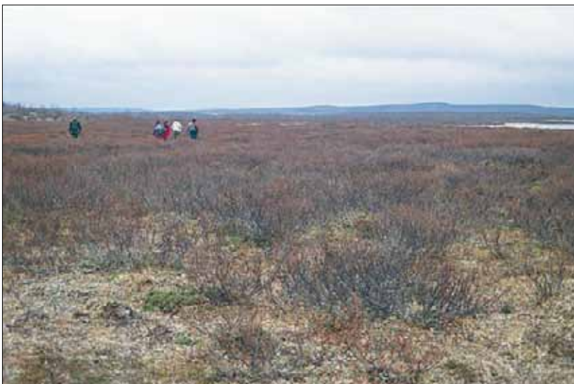
S2a Einer-dvergbjørkhei, fattig utforming: her helt dominert av dvergbjørk Betula nana , etter bladfelling, og med lavdominert bunnsjikt. Troms, Nordreisa, Raisjavre, 1992. NB, CI.