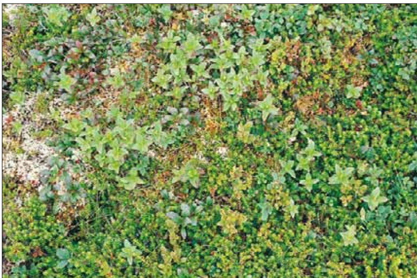
S3b Blåbær-blålynghei og kreklinghei, humid utforming; utsnitt av kreklinghei med Empetrum nigrum coll., bærlyngarter Vaccinium spp., rypebær Arctostaphylos alpinus og skrubbær Cornus suecica . Mosedominert bunnsjikt, med innslag av reinlav Cladonia spp. Møre og Romsdal, Aure, Litlefonna, 1993. LA, O3.

Referanser - S3a: Nordhagen (1943), Dahl (1956), Hagen (1976), Taagvold (1978), Sanderud (1982), S3b: Knaben (1950), Malme (1971), Baadsvik (1974c), Kristiansen (1975a), Taagvold (1978), Fremstad & Moe (1982), Johansen (1983), Økland & Bendiksen (1985, tab. 2a).