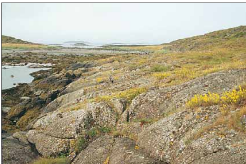
XIb Strandberg, rik utforming: gras- og urterik utforming med gulmaure Galium verum i blomst. Sør-Trøndelag, Bjugn, Asenøy, 1988. SB, O3.