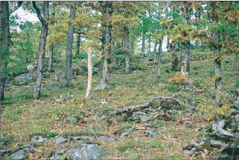
D1a Blåbær-eikeskog: bestand av sommerekik Quercus robur og osp Populus tremula , sterkt beitet av sau. Hordaland, Tysnes, Nedrevåg, 1978. BN, O2.

Arter - Typen er en sammensmelting av D4 Alm-lindeskog og C3 Gråor-heggeskog. Skilles fra D4 ved mangel på de fleste sørlige/nemorale arter; f.eks. de store nemorale grasartene. likhet med D4 inneholder D6 noen varmekjære arter; merket *