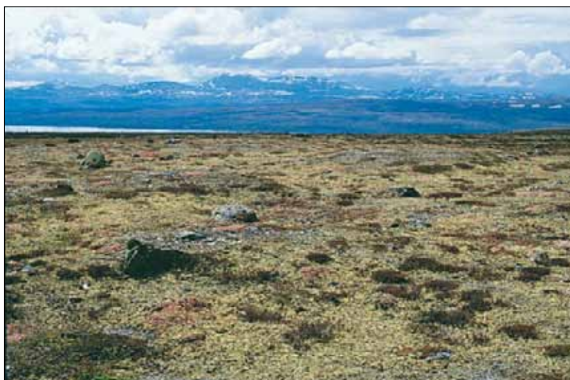
R1b Greplyng-lav/moserabb, lav-utforming: tidlig i sesongen med greplyng Loiseleuria procumbens i blomst. Dekker store arealer p  flyene p   stsiden av Femunden. Hedmark, Engerdal, Falkfangerh gda, 1985. LA, OC.

Referanser - R1a-b: Nordhagen (1928, 1943), Dahl (1957), Taagvold (1978), Pedersen (1980), Johansen (1983),  kland & Bendiksen (1985, tab. 15, 21 og 23). R1c: Dahl (1957), Malm  (1971), Fremstad (1980), Meyer (1983), Johansen (1983), Moe (1985), Reistad (in prep.). R1d-e: Nordhagen (1943), Dahl (1957), Hagen (1976).