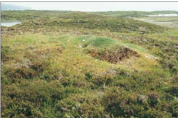
X2b Fuglegjødslite kystvegetasjon, gras-urt-utforming: her fuglegjødslite tue i kystlynghei, med mye smyle Deschampsia flexuosa og gulaks Anthoxanthum odoratum ssp. odoratum . Sør-Trøndelag, Bjugn, Været i Tarva, 1988. SB, O3.

Referanser - Nordhagen (1922, 1925), Grønlie (1948), Iversen (1984), Sortland (1989), Alm & Sortland (1989), Lundberg (1989); en del lav angitt etter Lundberg & Losvik (1993).