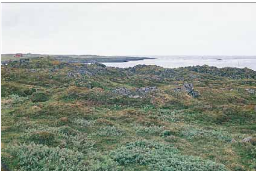
R4a Reinrose-kantlyng-mose-rabb, reinrose-utforming: rik hei med reinrose Dryas octopetala , i tynt dekke over berg; i senkingen rikt vierkratt, nærmest beslektet med S7, men uten høystauder. Finnmark, Gamvik, Gamvik, 1992. Hemiarktisk (Moen 1998), O1.