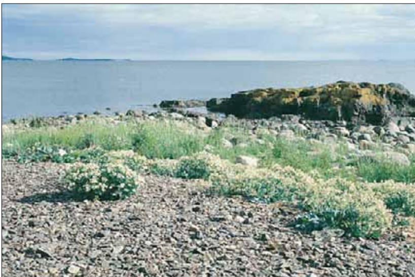
V5b Driftinfluert grus/steinstrand, strandkål-utforming: strandkål Crambe maritima sammen med strandrug Leymus arenarius og en rekke urter. Østfold, Moss, Jeløya, 1995. BN, O1.