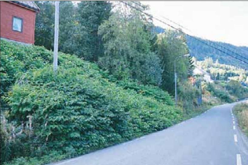
I2d Vegetasjon på vegkanter og annen skrotemark, én-artutforming: hage og vegkant invadert av hybriden Fallopia x bohemica . Bakover i bildet ses flere bestand. Nord-Trøndelag, Verran, Follafoss, 1994. SB, OI.