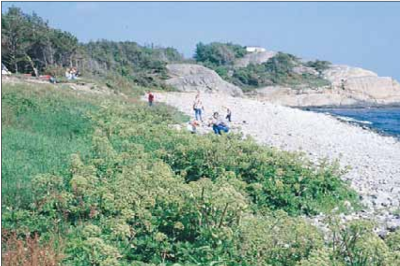
V5a Driftinfluert grus/steinstrand, strandkvann-utforming: sammenhengende belte med strandkvann Angelica archangelica ssp. litoralis . Aust-Agder, Arendal, Tromøya, 1995. BN, O2.

V5c Østersurt-utforming. Åpne bestand av østersurt Mertensia maritima på sand eller grus på eksponerte strender,