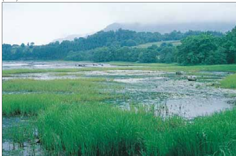
U8c Brakkevannssump, havstarr-utforming: grunn fjordvik med havstarr Carex paleacea , omgitt av svartor Alnus glutinosa . Sogn og Fjordane, Askvoll, Straumen, 1978. BN, O3.

U9b Smårørkvein/sandsiv-utforming Engpreget sumpsamfunn på leire/silt, normalt uten torvdannelse. Dominans av smårørkvein Calamagrostis stricta og/eller sandsiv Juncus arcticus ssp. balticus , og urter, ofte uten bunnsjikt. Mindre avhengig