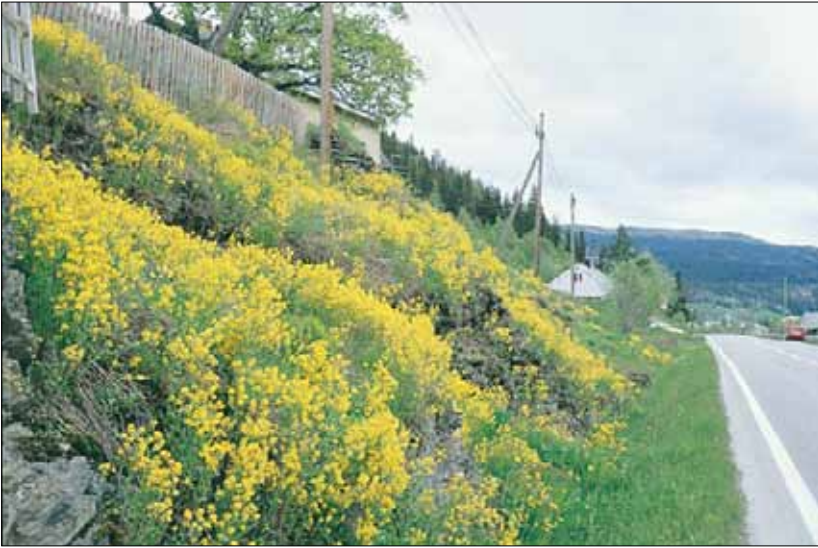
I2b Vegetasjon på vegkanter og annen skrotemark, burotutforming: vegskråning i forsommeraspekt dominert av vinterkarse Barbarea vulgaris . Oppland, Øystre Slidre, Rogne, 1995. MB, OC.