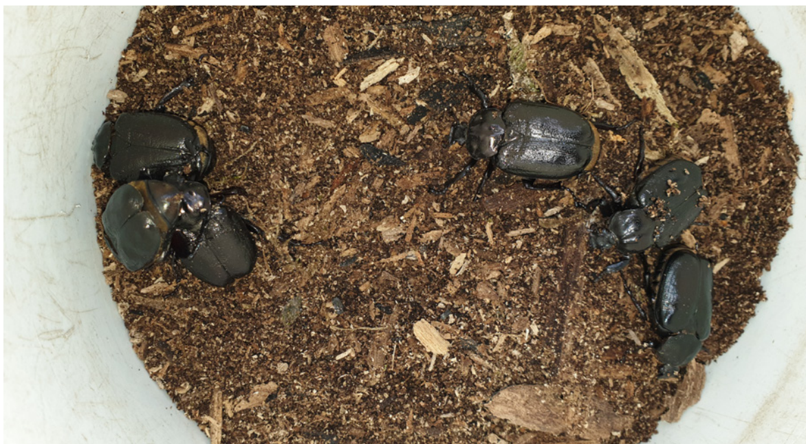
Figur 11. De seks voksne eremitt-individene som ble påvist i 2019.

Tabell 1. Oversikt over trær med spor etter eremitt fra 2010–2019. For trerekke og trenummer henvises det til kart ( Figur 12 ). Koordinater er i UTM WGS 84 og innmålt med høy presisjon. x = spor etter eremitt i form av fragmenter og ekskrementer, eller individer i form av egg/larve/voksen bille (se detaljer i tabell 1, Vedlegg 1 ).