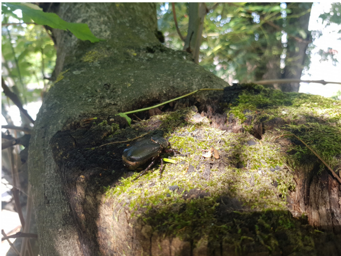
Figur 6. Voksen hunn av eremitt ca. 7 m oppe i tre 02-01.