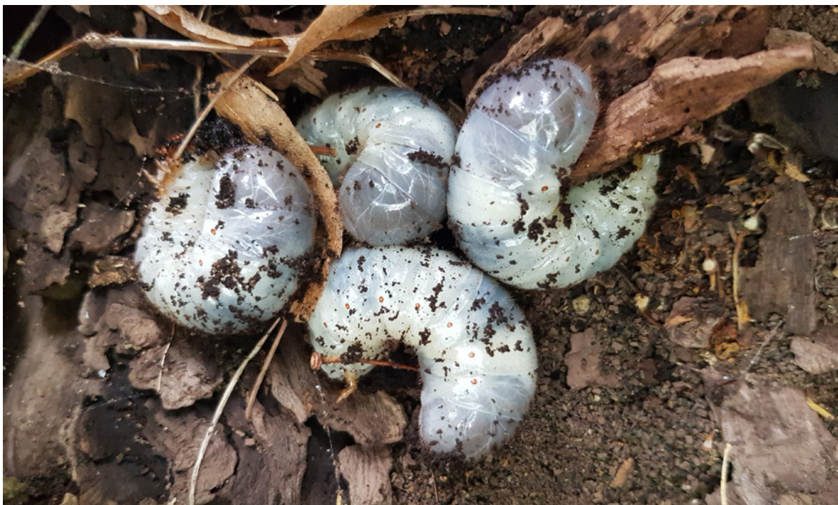
Figur 9. Fire eremittlarver fra ask 08-03 nord på Tønsberg kirkegård ved parkeringsplassen ved Kaptein Hoff's allé.