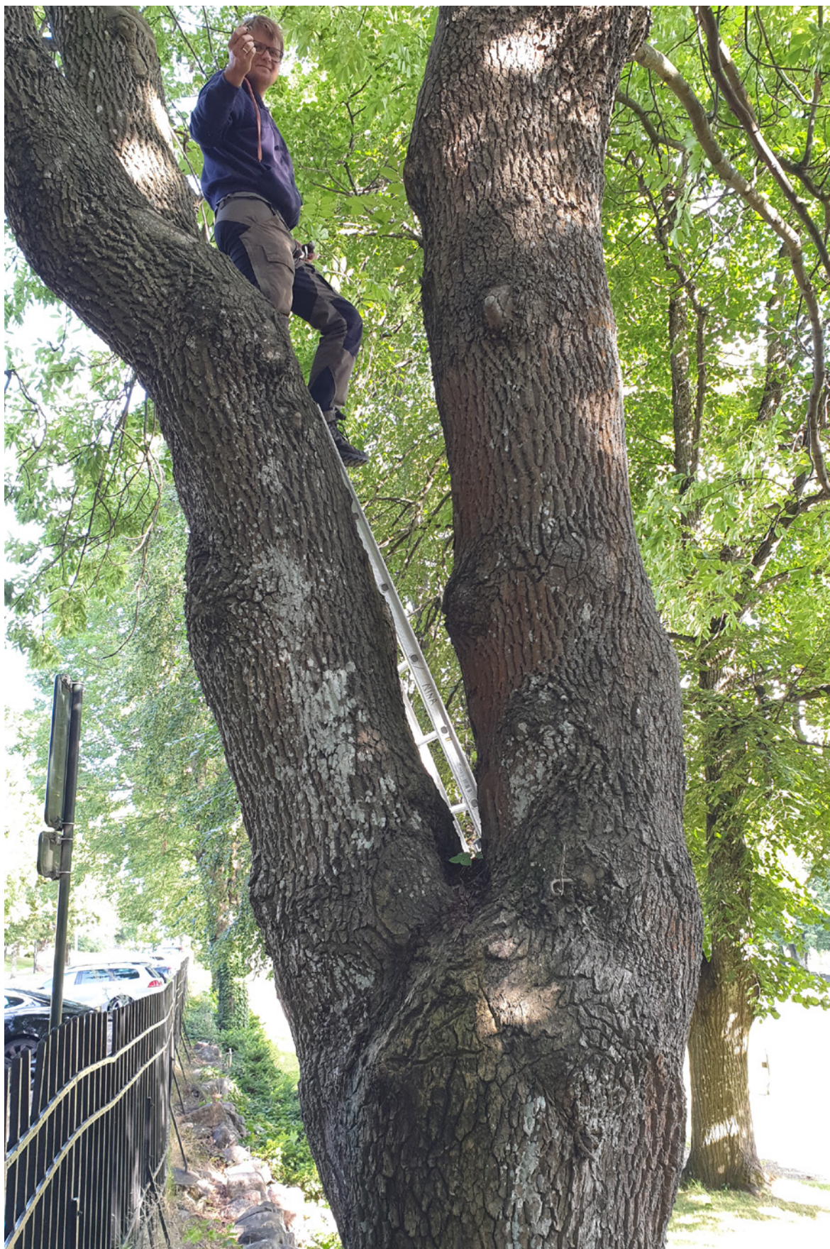
Figur 10. Endelig ble eremitten funnet nord på Tønsberg gamle kirkegård, og da ved parkeringsplassen ved Kaptein Hoffs allé. Vi har lenge ment at det var et bra sted for eremitt.