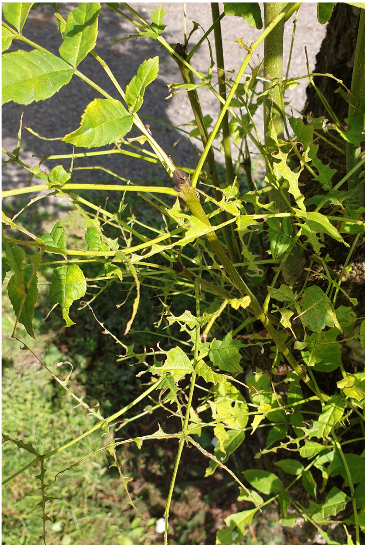
Figur 16. Gnag av askebladveps Tomostethus nigrinus på Tønsberg gamle kirkegård.