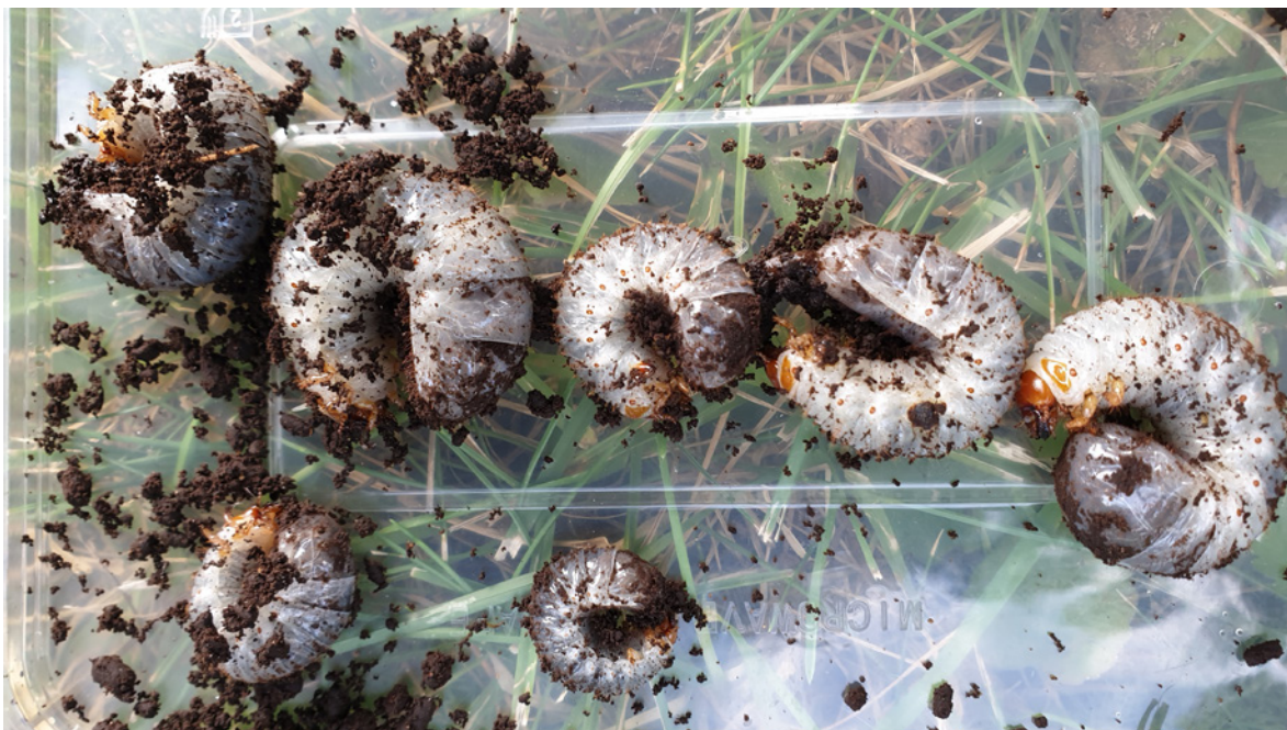
Figur 14. De tre minste av disse larvene ble satt ut i eikehagen ved Berg, sammen med to larver fra et annet tre.