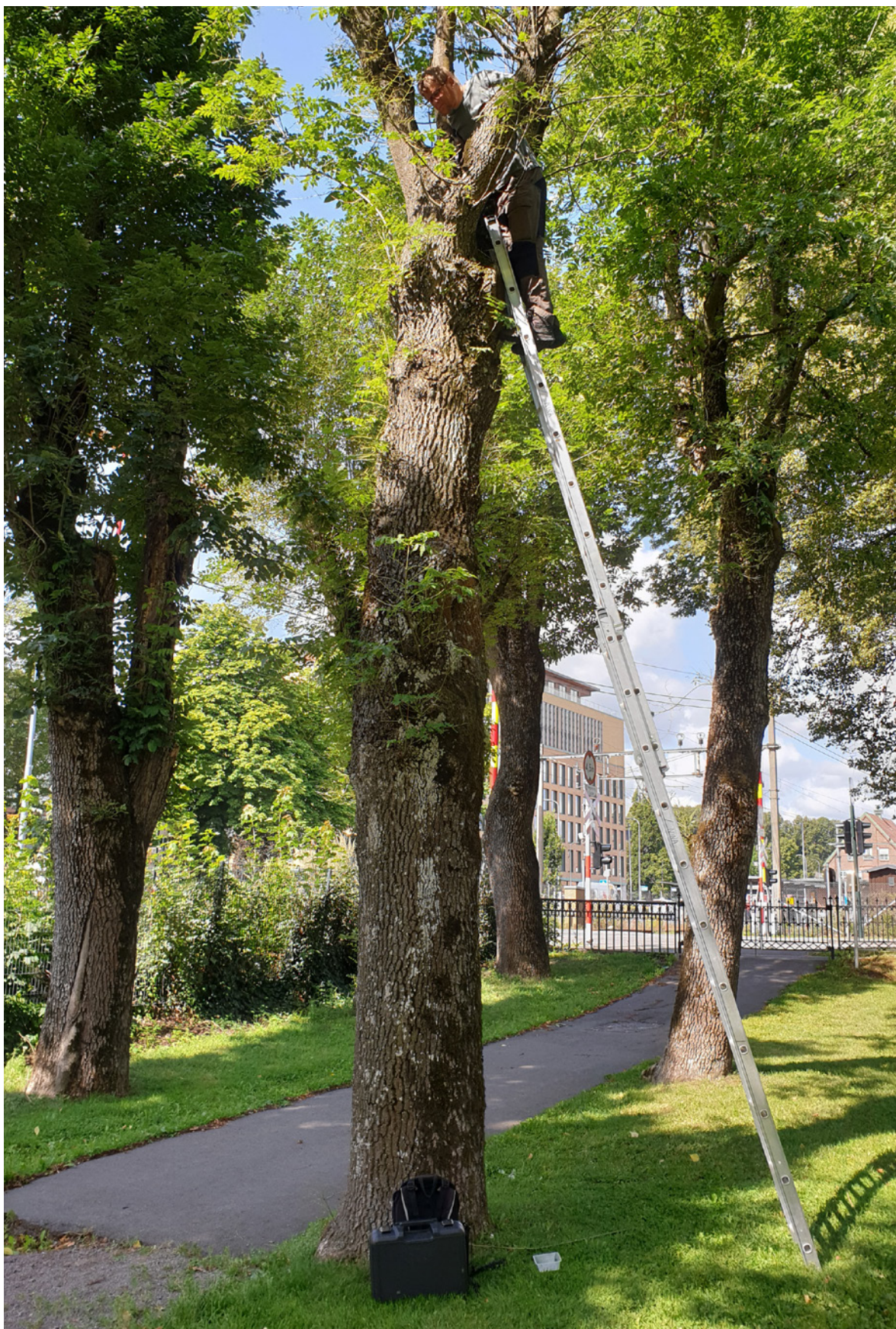
Figur 5. Undersøkelse av hul ask (tre 02-02).