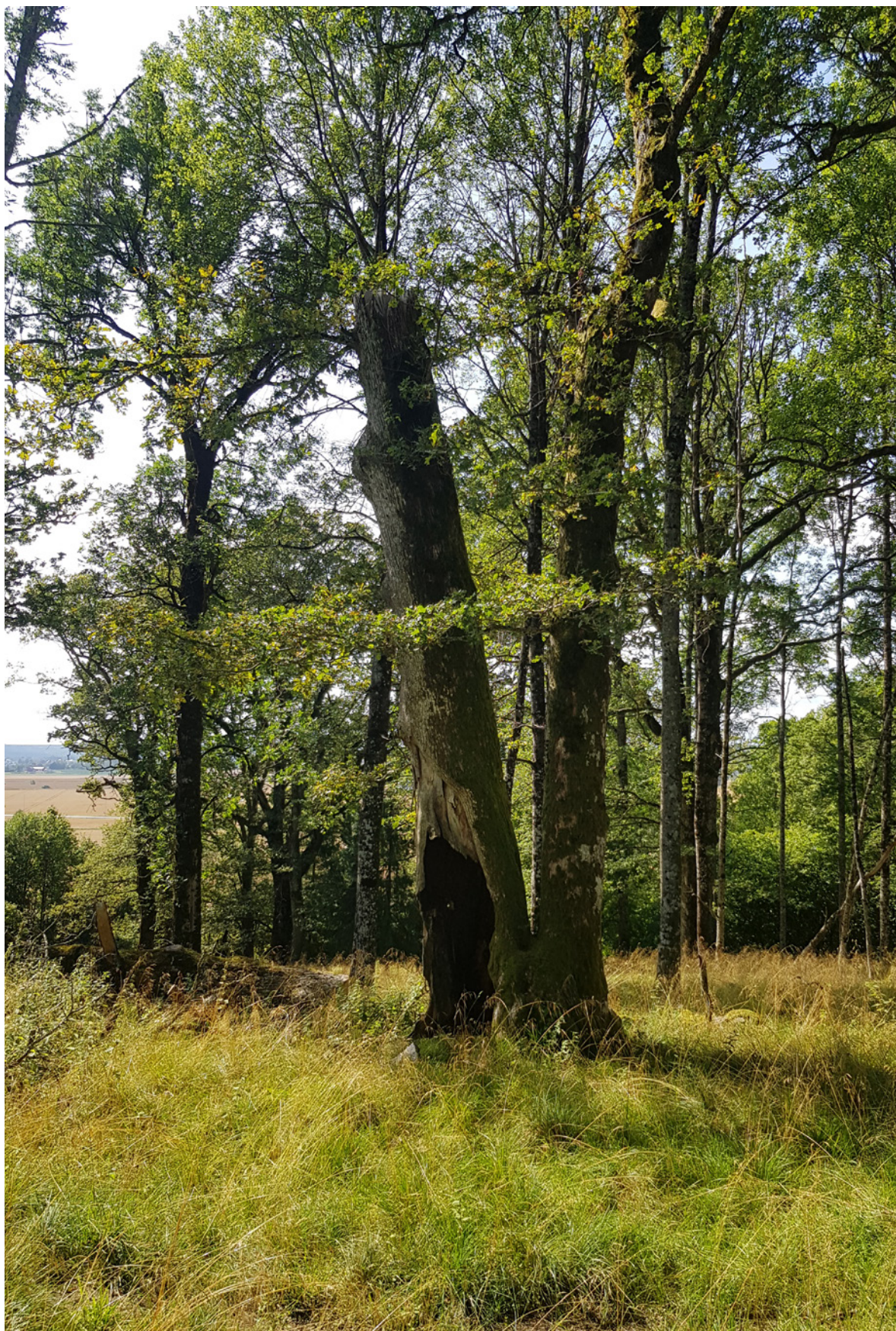
Figur 17. «Skilderhuseika» etter at store deler av krona er fjernet.