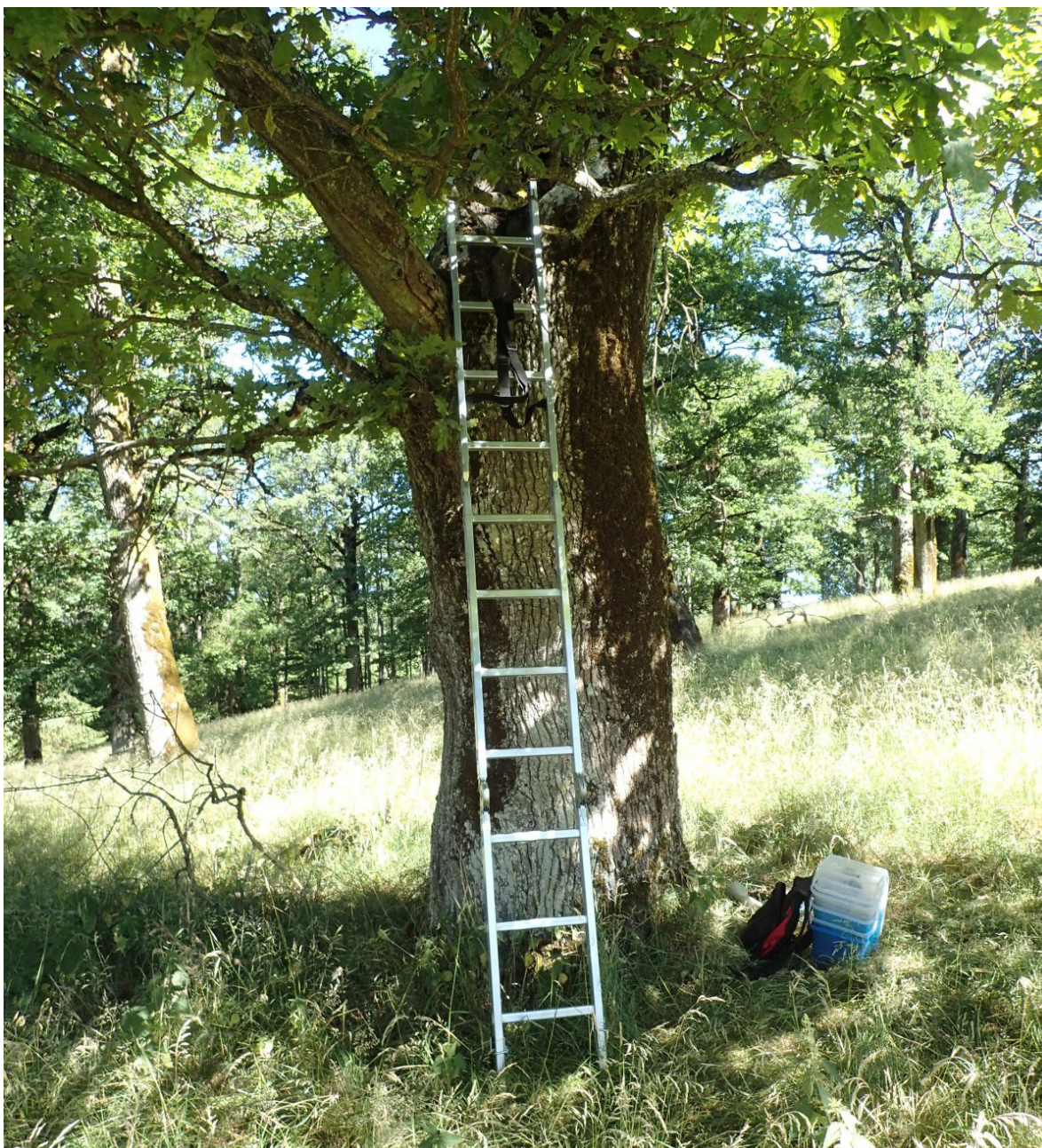
Figur 3. Utsetting av eremitt i eikehagen ved Berg fengsel 1. juli 2018. Denne utsettingen markerte slutten på avls-piloten, som har foregått siden 2012.

Årets deloppdrag besto i å supplere den nye populasjonen i eikehagen ved Berg fengsel med flere individer fra Tønsberg gamle kirkegård, samt å undersøke det aktuelle treet i eikehagen for spor etter eremitt.