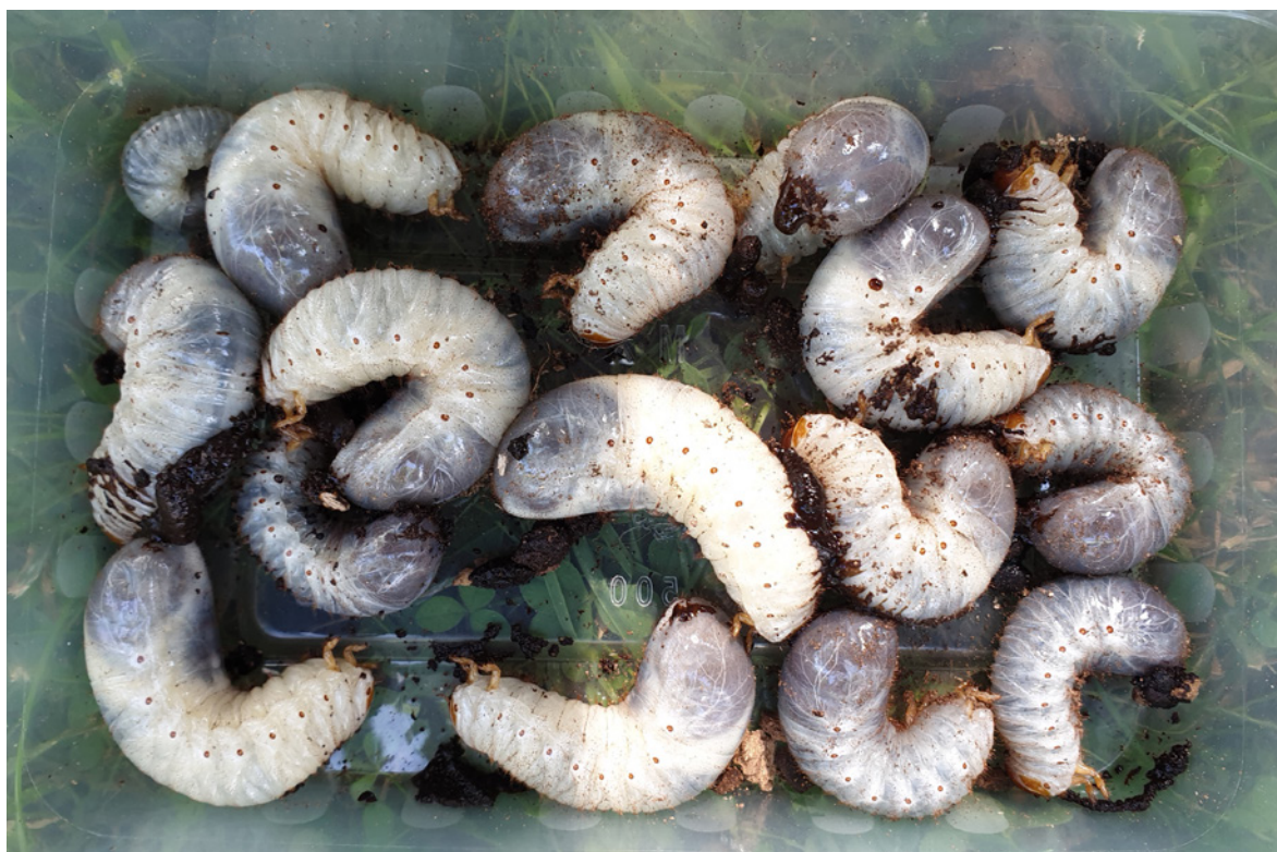
Figur 2. Larver av eremitt Osmoderma eremita .

Denne rapporten beskriver i hovedsak oppfølgende overvåking på Tønsberg gamle kirkegård og oppfølgende utsetting i eikehagen ved Berg fengsel i 2019.