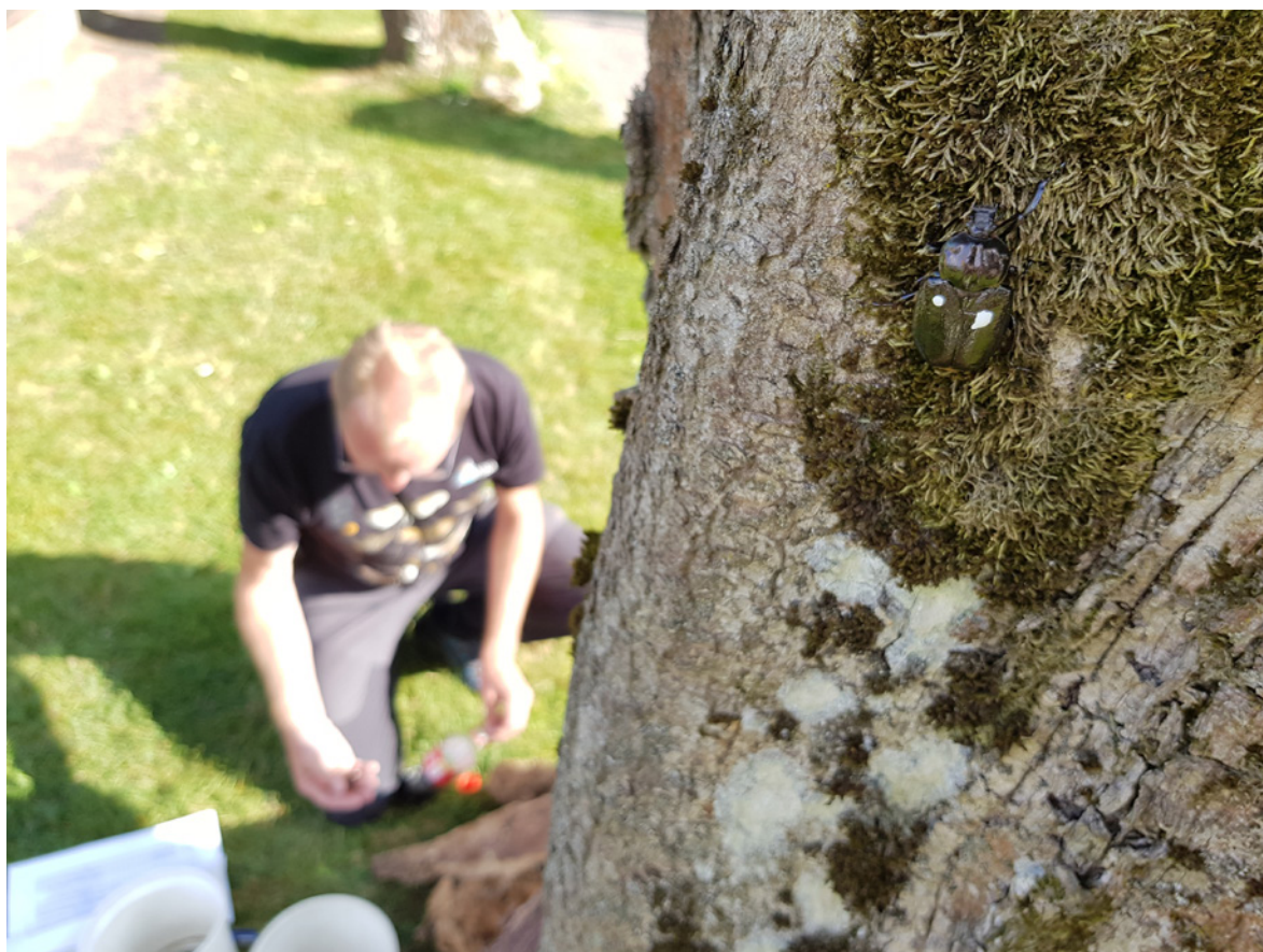
Figur 13. Merking og slipp av eremittbiller.