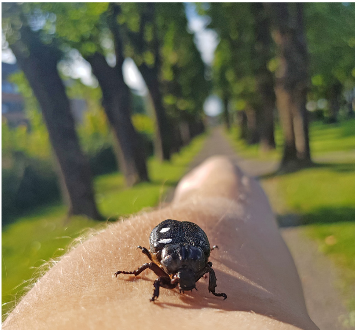
Figur 1. Eremitt Osmoderma eremita (Scopoli, 1763) på Tønsberg gamle kirkegård 7. august 2019.