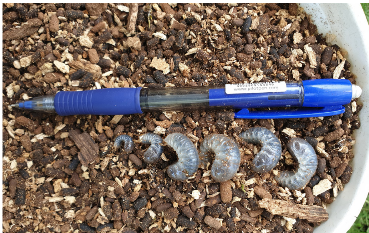
Figur 7. Seks larver av eremitt i ulike størrelser påvist i tre 01-07.