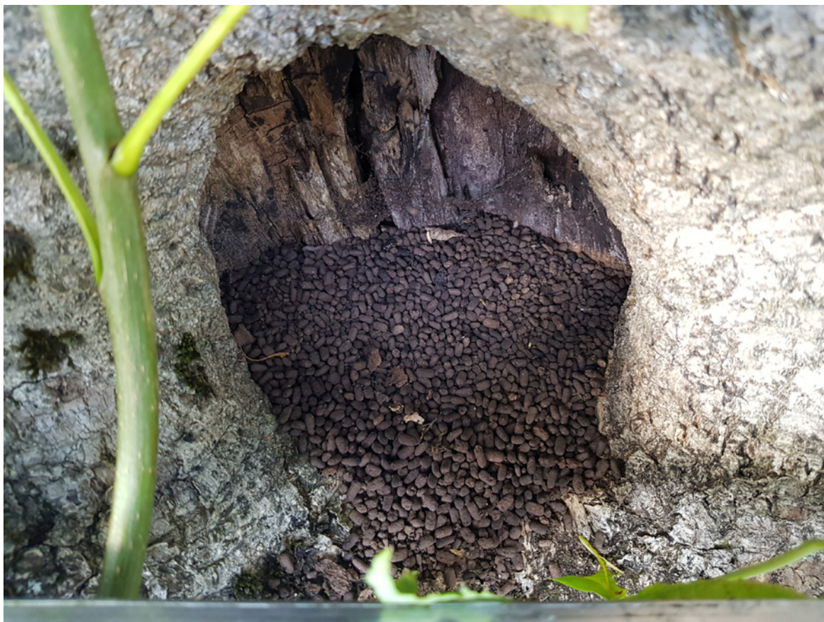
Figur 4. Ekskremitter av eremitt på Tønsberg gamle kirkegård.

Tidligere hadde vi påvist spor etter eremitt i 23 trær (+ ett kun med kitin). I 2019 fant vi totalt spor etter eremitt i 22 trær, ett tre med kun kitin (07-04) ( Figur 12 ). I dette sistnevnte treet (spisslønn)