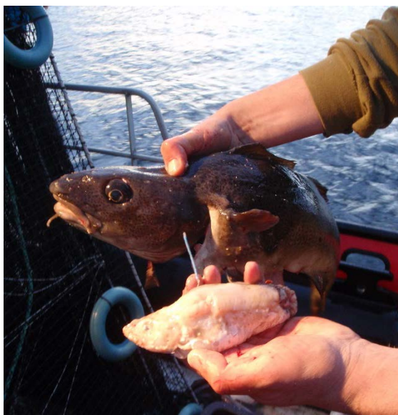
Figur 6. Merket torskeyngel spist av torsk fanget ved oppdrettsanlegg

En annen mulig årsak til tiltrekning er at større villfisk lokkes til oppdrettsanlegg fordi mindre byttedyr også samles der. Både Dempster mfl. (2011) og Sæther mfl. (2012) dokumenterte at større torsk og sei fanget ved oppdrettsanlegg hadde spist mindre fisk, hovedsakelig småsei, som trolig var tiltrukket anleggene på grunn av tilgang på spillfôr (Figur 6). Serra-Linares mfl. (2013) viste også at større torsk og sei som