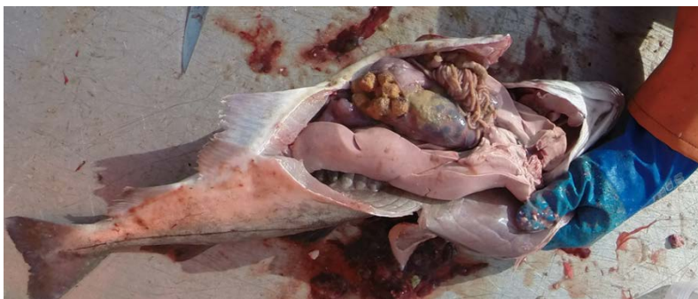
Figur 9. Hyse med pellets i magesekken

Uglem mfl. (2017, 2020) undersøkte også smak og kvalitet hos sei fanget ved oppdrettsanlegg. Det ble i enkle smakstester (to ulike retter i forbrukertester) ikke påvist at sei fanget nær oppdrettsanlegg smakte vesentlig dårligere enn sei fanget et stykke unna anlegg, men tvert i mot at ovnsbakt sei fanget ved oppdrettsanlegg smakte noe bedre enn upåvirket sei. Det ble også påvist mindre forskjeller i filet kvalitet for sei fanget ved oppdrettsanlegg og upåvirket sei, men forskjellene var i gjennomsnitt ikke store nok til at de kunne forklare de markante forskjellene som fiskere opplever. Andelen sei med vesentlig redusert filet kvalitet var imidlertid høyere for sei fanget nær oppdrettsanlegg enn kontrollsei. Dersom andelen av sei med redusert kvalitet blir høy nok kan den totale fangsten bli nedgradert på bakgrunn av dårlig kvalitet. Kvalitetsopplevelse kan også være relatert til andre faktorer enn reell kvalitet. Fisk med mye pellets i magesekken lukter og ser uappetittlig ut når den sløyes (Figur 9) og sei som har spist mye laksefôr over lang tid kan ha en unaturlig kroppsfasong, noe som kan bidra til å danne et inntrykk av at kvaliteten er redusert for såkalt «pellets-sei».