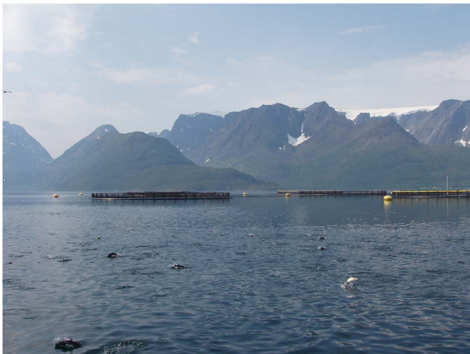
Figur 4. Sei ved oppdrettsanlegg i Øksfjord

Det er vist at til dels store mengder villfisk kan tiltrekkes oppdrettsanlegg. I Norge har Dempster mfl. (2010) anslått at et gjennomsnitt på rundt 10 tonn villfisk periodevis samles rundt oppdrettsanlegg på ett gitt tidspunkt i sommerhalvåret. Dempster mfl. (2009, 2010) estimerte kun biomasse nært merdene og anslaget er derfor trolig et underestimat. Dette støttes av observasjoner fra Ryfylke som indikerer at betydelig større mengder sei (>100 tonn) kan samles ved lakseanlegg.