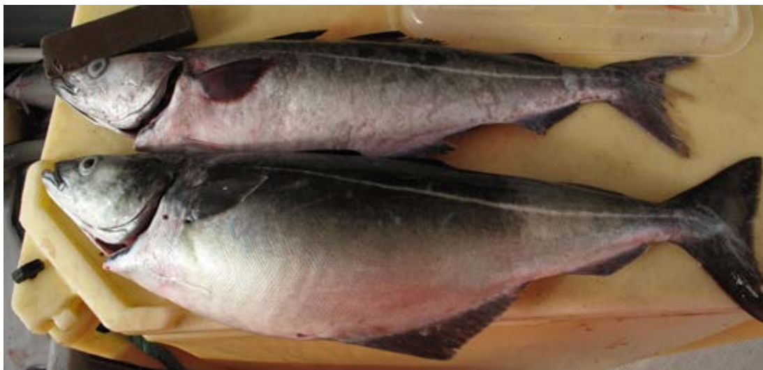
Figur 7. Sei som har spist spillfôr er ofte i god kondisjon

Utslipp av organisk materiale i form av spillfôr kan føre til økt vekst og biomasse hos fisk som samles ved anleggene. Det er også godt dokumentert at villfisk som tiltrekkes oppdrettsanlegg har større energireserver enn villfisk som er fanget et stykke unna oppdrettsanlegg (oppsummert i Uglem mfl. 2014, Figur 7).