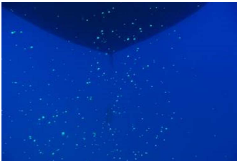
Figur 2. Spillfôr

Mengde spillfôr fra sjøbaserte oppdrettsanlegg bestemmes av fôringsregimet og har blitt antatt å være i størrelsesorden 3-7 % av utfôret mengde (Kutti 2008; Reid mfl. 2008; Otterå mfl. 2009; Torrisen mfl. 2016). Den økonomiske fôrfaktoren har de siste årene ligget rundt 1,3 ( www.barentswatch.no/havbruk/foringrediens-til-fisk ), noe som indikerer at fôrspillet kan være høyere enn det som er antatt. En undersøkelse av fôrtap fra oppdrett i