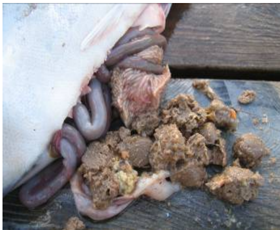
Figur 5. Sei med spillfôr i magesekken

Det er gjort få systematiske forsøk på å måle i hvor stor grad spillfôr utgjør dietten til villfisk i nærheten av oppdrettsanlegg. I Norge er det påvist at laksepellets i gjennomsnitt utgjorde henholdsvis 71 % og 25 % av dietten til sei og torsk fanget i nærheten av oppdrettsanlegg i sommerhalvåret (Dempster mfl. 2011). Nesten 44 % av seien hadde pellets i magesekken, mens den tilsvarende andelen for torsk var 20 %. Sei og torsk fanget på kontroll-lokaliteter hadde ikke laksepellets i magesekken. Sæther mfl. (2012) viste også at torsk av ulik størrelse varierte med hensyn til hvor mange som hadde pellets i mageinnholdet. Andelen av torsk som var mindre (N=34) eller større (N=46) enn 60 cm som hadde spist pellets var henholdsvis 32 % og 11 % (Sæther mfl. 2012).