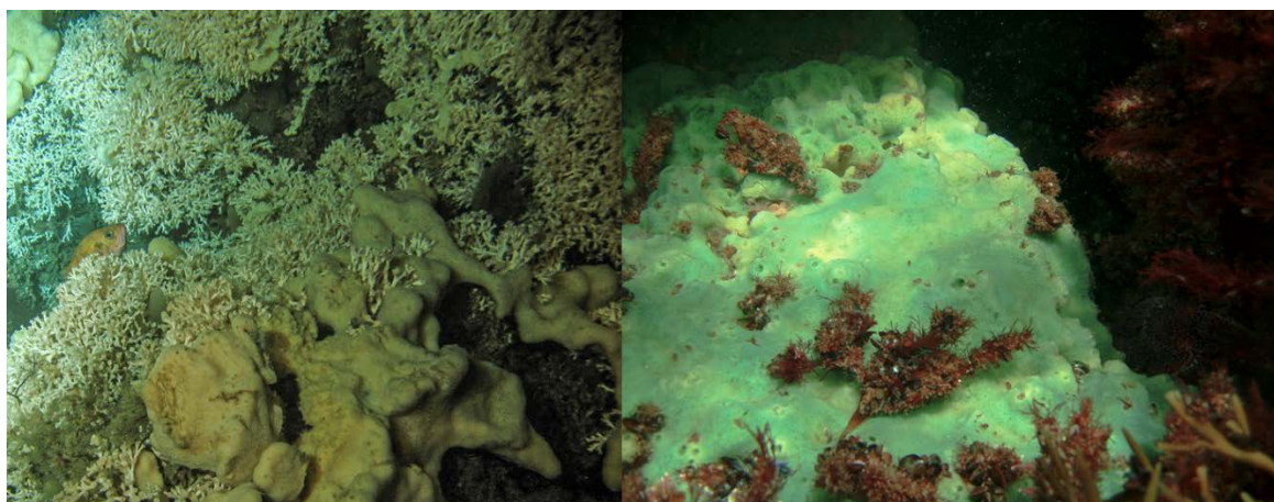
Figur 3. Dypvannskorallen Lophelia pertusa og svampen Geodia sp. til venstre. Den mer grundlevende brøds- muldsvampen Halichondria panicea til høyre.

Utslipp fra oppdrett kan også påvirke dypvannskoraller (figur 3) gjennom reduksjon av korallenes vekstrate nær anleggene og økt erosjon av kalkskjellettet som korallrev hviler på (Kutti mfl. 2015). Koraller er generelt sensitive for organiske utslipp med negative effekter på vekst, overlevelse og reproduksjon (Bongiorni mfl. 2003, Villanueva mfl. 2006; Huang mfl. 2011). Kunnskapen om forekomst og utbredelse av korallrev i Norge er mangelfull og man vet lite om eventuelle påvirkninger fra utslipp fra oppdrettsanlegg. Det er også vist at små fôrpertikler kan forårsake fysiologisk og cellulært stress hos kålrabisvamp (Kutti mfl. 2016).