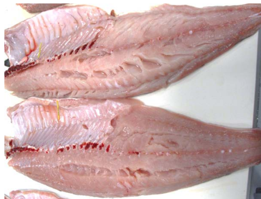
Figur 8. Sei som har spist mye spillfôr kan ofte være løse i kjøttet

Sæther mfl. (2012) undersøkte sei og torsk fanget ved oppdrettsanlegg sammenlignet med kontrollfisk fanget i områder presumptivt upåvirket av oppdrett. Det var generelt ingen vesentlige forskjeller i filetindeks mellom de ulike prøveuttakene eller mellom garnfanget kontrollfisk og levendefanget fisk fra oppdrettsanlegg som kunne indikere at fisk fanget nær anlegg avvok betydelig fra kontrollfisk. Det ble i sensoriske smakspaneltester ikke funnet store forskjeller mellom fisk fanget nær eller langt fra oppdrettsanlegg, men det var marginale forskjeller som tydet på at fisk fanget nær lakseanlegg var av bedre kvalitet enn fisk fanget langt unna anlegg. Otterå mfl. (2009) undersøkte om