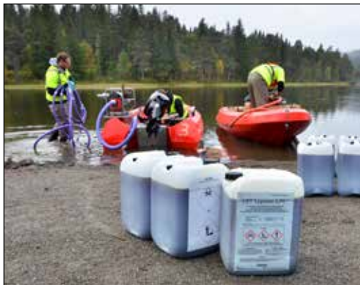
Opplasting av rotenon i båt.