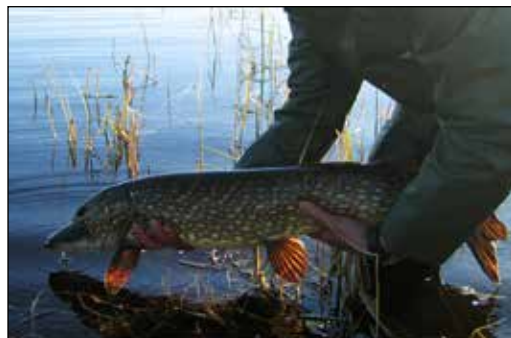
Gjedda er en effektiv rovfisk som ofte oppnår ei vekt på over 10 kg.

Høsten 2013 ble Skjeltjørna og fire andre vatn (Ertstjørna, Vulusjøen, Mørkdalstjørna og