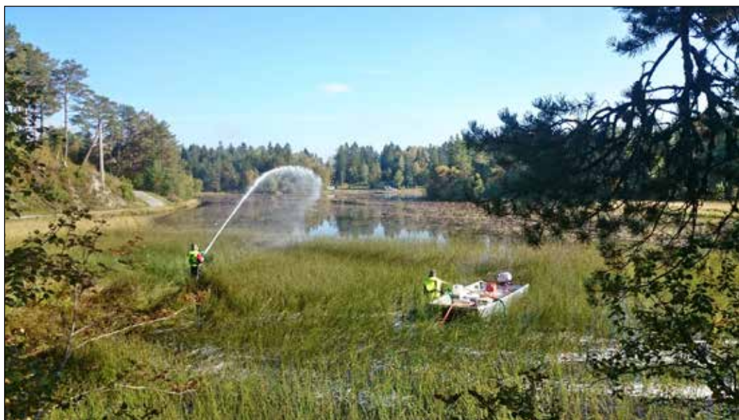
Breddespyling av rotenon.

Rotenon utvinnes av derrisrot som er røtter av tropiske og subtropiske planter i gruppene Derris og Lonchocarpus innen erkeblomstfamilien (Leguminosae) (USEPA 2007). Rotenon virker ved å blokkere elektrontransportsystemet i mitokondriene og hemmer derved respirasjonen på cellednivå. I Norge brukes rotenonløsningen CFT-Legumin, der 3,3 % av det ellers svært lite vannløselige virkestoffet er blandet med ulike løsnings- og dispergeringsmidler. Normal doseringskonsentrasjon ved bekjempelse av gjedde er ca. 33 µg rotenon pr. liter, tilsvarende én milliondel (ppm) av rotenonløsningen CFT-Legumin. Både rotenon og hjelpestoffene i løsningen brytes etter hvert ned til ufarlige stoffer, avhengig av temperatur og lystilgang (Finlayson mfl. 2010). Tiden det tar før rotenon forsvinner varierer fra noen få dager i grunne dammer til flere måneder i dype kalde innsjøer. Rotenon er svært giftig for fisk og har ellers varierende giftighet for andre akvatiske organismer. Fisk tar meget lett opp rotenon over gjellene, og gjedde er blant de fiskeartene som har lavest rotenontoleranse. De akutte virkningene på bunndyr kan også være betydelige, men både diversitet og biomasse reetableres i løpet av relativt kort tid (Arnekleiv mfl. 2015). Responsen blant akvatiske invertebrater overfor rotenon varierer, og den avhenger også i stor grad av eksponeringstiden (Fjellheim 2004, Eriksen mfl. 2009, Kjærstad mfl. 2018).