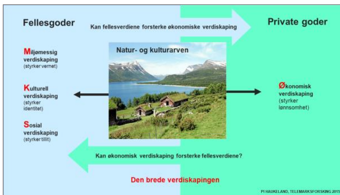
Figur 1 Forholdet mellom fellesgoder og private goder

Mange aktører er involvert i dynamikken mellom private goder og fellesgoder. Prosjektene skal vise hvorvidt det går an å utvikle en «vinn-vinn» mellom bruk og vern, og vise at privat bruk av fellesgodene ikke privatiserer dem og ender opp i et «vinn-tap», der enten vernet eller bruken forringes. Figur 1 viser en illustrasjon på forholdet mellom fellesgoder og private goder som vi har brukt på Telemarksforskning i flere år, og som her er knyttet til de ulike verdiskapingsformene.