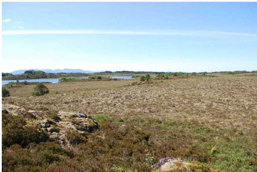
Figur 3. Nedbørmyr (atlantisk høgmyr) på Gule-Stavikmyran, Fræna, Møre og Romsdal.

Basert på avsetningsverdier for N i Aas et al. (2008) er nedre tålegrense for nedbørmyr (500 mg N/m 2 /år) overskredet i lavlandsområder i søndre deler av Østlandet, på Sørlandet, i Rogaland og langs kysten til og med Nordvestlandet i Møre og Romsdal, med de klart høyeste verdier på Sørlandet og Sør-Vestlandet. Enkelte myrområder i Nordland har også fått overskredet tålegrensen. Det er likevel ikke rapportert om artsendringer i norske myrtyper relatert til lufttransportert N.