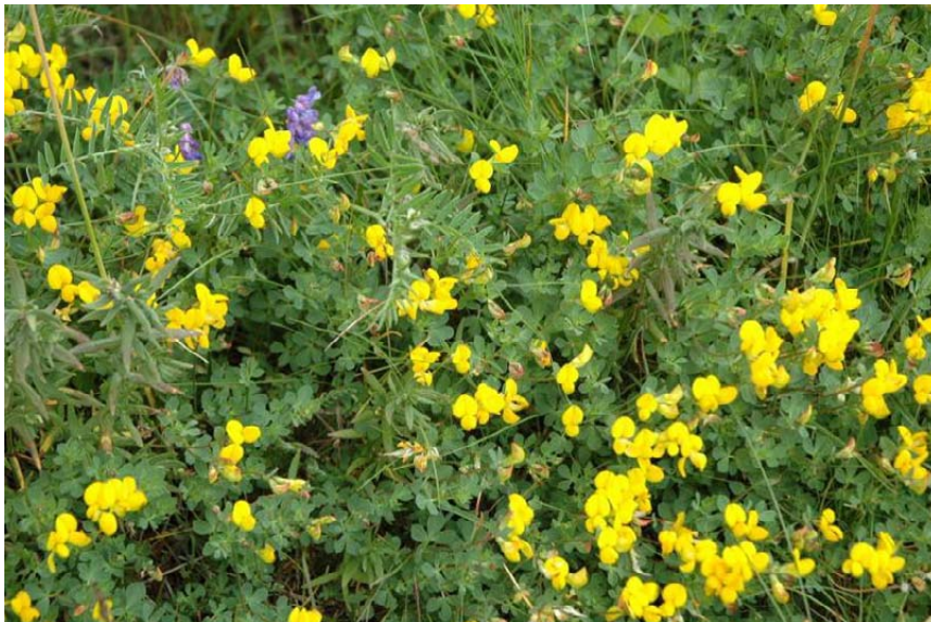
Figur 6. Artsrik fattig eng med tiriltunge.

I samme prosjekt har Dupré et al. (2010) ved historiske studier påvist en systematisk endring i forekomst av plantearter i oligotrofe enger og nedgang av artsdiversitet de siste tiår, noe som også knyttes til vedvarende høy N-avsetning. Generelt viser studiene at grasdominansen øker på bekostning av moser, urter og dvergbusker. Arter som responderer positivt på atmosfærisk N-tilførsel er engkvein, rødsvingel, smyle og engsyre, mens arter som taper i konkurransen er blåklokke, skogfiol, engfiol ( Viola canina ), tiriltunge (Figur 6), røsslyng, klokkelyg og etasjemose ( Hylocomium splendens ).