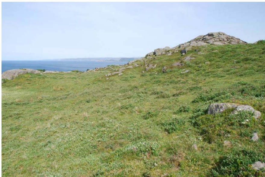
Figur 5. Kystlynghei i et område der N-tålegrensen for naturtypen er overskredet. Lista, Vest-Agder.