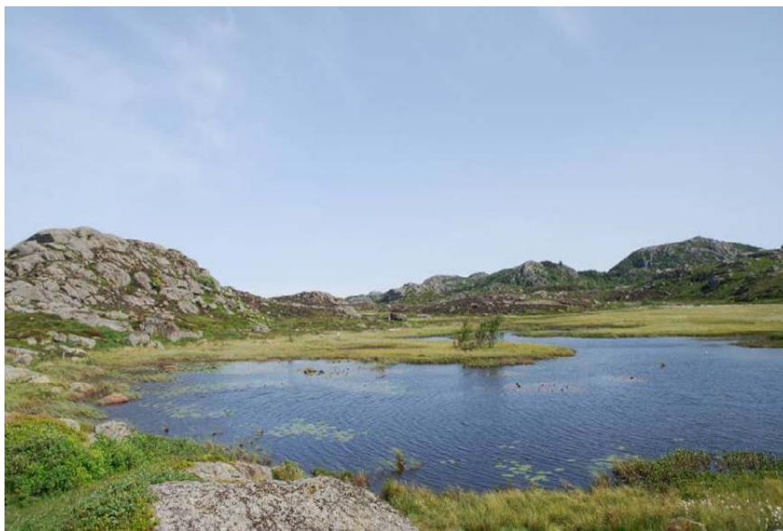
Figur 8. Fattig vannvegetasjon med flytebladsplanter, trolig også en utsatt naturtype for N-avsetning. Lista, Vest-Agder. Foto: P.A. Aarrestad.

En norsk spørreundersøkelse av Lindstrøm (1993) viste at det over de siste 20-30 årene har vært en økning av fastsittende alger i flere vassdrag i Norge. En studie av 47 elver i avsidesliggende fjellområder med bakgrunnsverdier på 200-600 mg N/m 2 /år gav indikasjoner på at den økte algeveksten delvis kan skyldes økt N-avsetning gjennom de siste tiårene (Lindstrøm et al. 2000). Sammenhengen mellom økt N-avsetning med nedbør og algevekst i norske elver er også vist ved eksperimentelle forsøk av Lindstrøm (2001).