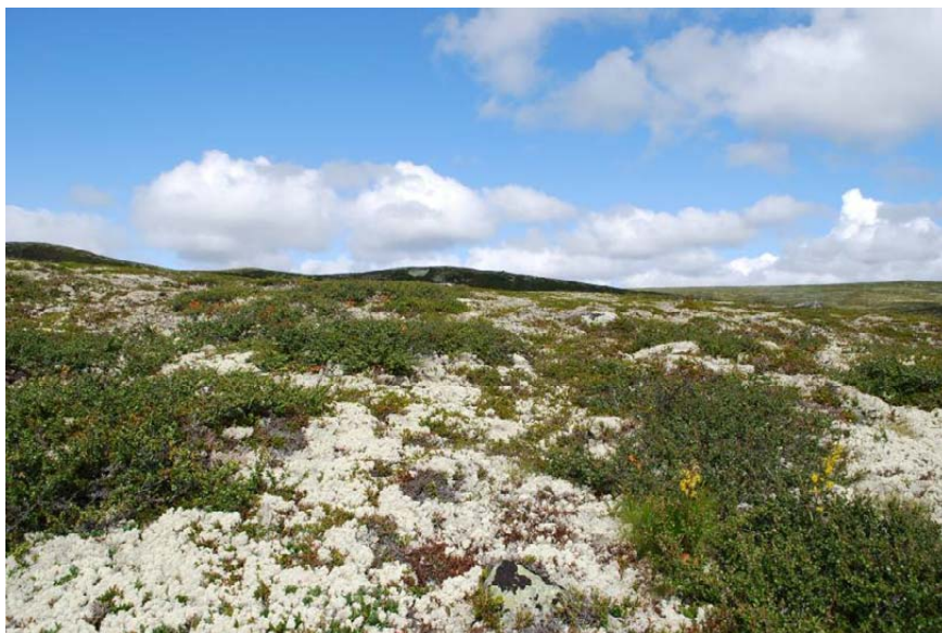
Figur 7. Fattig rabbevegetasjon. Hardangervidda, Tinn, Telemark.

Den nedre tålegrensen for fjellvegetasjon er overskredet i fjellområder lengst sør i Norge og langs kysten nord til Møre og Romsdal fylke med enkelte området på Nordvestlandet og i Nordland. De sentrale fjellområdene i sør og midt Norge og i Troms og Finnmark har ikke overskridelser av tålegrensen. Disse arktiske heiene har mye de samme økologiske forhold som norske alpine heier.