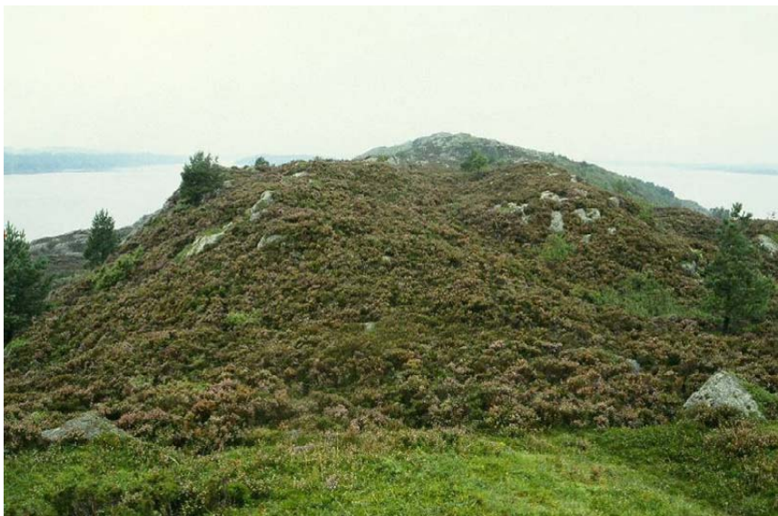
Figur 4. Kystlynghei i et område der N-tålegrensen for naturtypen ikke er overskredet. Lurekalven, Hordaland.

Tålegrensen for kystlynghei er satt fra 1000-2000 mg N/m 2 /år. Både tørre og fuktige kystlyngheityper er gitt samme tålegrense. Basert på N-avsetningsverdier i Aas et al. (2008) er nedre tålegrense for kystlyngheier overskredet på Sørlandet, i Rogaland og i Hordaland.