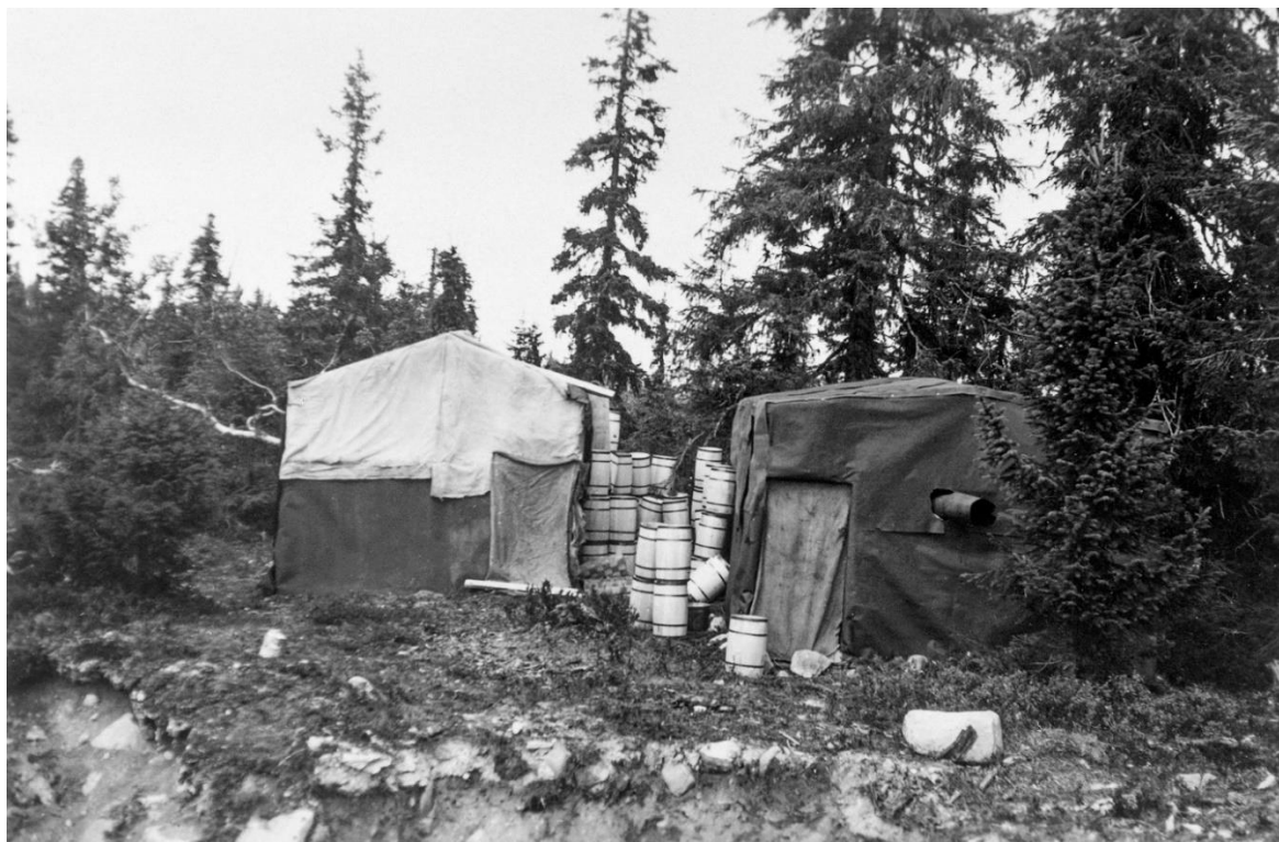
Etablering av teltleirer og midlertidige hytter gjorde det mulig for molteplukkerne å være på fjellet i ukesvis for å plukke molte. Bildet er tatt på Ljøsheim på Ringsakfjellet, og det viser alle molteottingene som ble oppbevart midlertidig utenfor teltene.

Oppsvinget i molteplukkingen førte til at moltemyrene på Hedmarksvidda nærmest ble overbefolket. Omfanget av overnattinger i fjellet, både i telt og i midlertidige hytter, økte. Ved Nyseteren hadde molteplukkere fra Løten etablert seg med teltleir på over 20 telt, og de hadde både hugget et par små rager, og de hadde samlet ved til koking. Bestyreren i den Philske allmenningen i Ringsaker hadde sett seg lei på dette, og han gjorde sankerne oppmerksomme på at både telting, vedplukking, og det å gjøre opp varme i skogen var ulovlig. For molteplukkerne var disse forbudene ukjente, og i strid med tidligere praksis. Dette førte til at lensmannen i Ringsaker kom til teltleiren og tok opp forklaring. Molteplukkerne mente at allmenningen gjorde det vanskeligere for plukkerne. Blant annet var bompengavgiften hevet med fem kroner etter at plukkerne var reist til fjells (Hamar stiftstidende, 1931b).