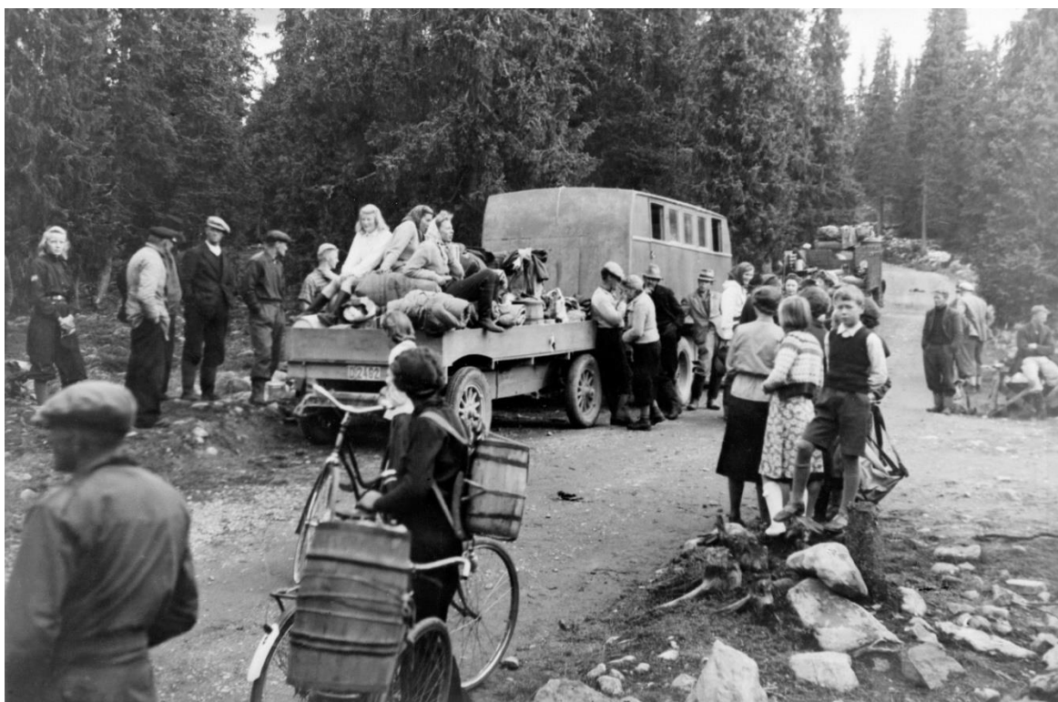
Under okkupasjonstiden var både syklene og lastebilene viktige fremkomstmidler for å komme seg til moltemyrene i Ringsaker almenning (1943).

Før sykkelen, mopeden og lastebilens tid var det en naturlig begrensning i omfanget av antallet plukkere. Molteplukkerne bar provianten til fjells, for deretter å spasere et par mil tilbake til bygda igjen med fulle moltedunker surret inn i en hjemmelaget ryggmeis. De nye kommunikasjonsmidlene gjorde det mulig å forflytte seg til nye molteområder etter hvert som moltene ble modne. I tillegg til arbeidsledigheten så kan både utbedring av veinettet og nye kommunikasjonsmidler tilskrives den sterkeste rollen som en aktør som i stor grad påvirket skikkene rundt bærplukkingen. Flere folk fikk lettere tilgang på myrområdene, og det førte til mer molteplukking, mer kartplukking og en oppsving i bærmarkedet.