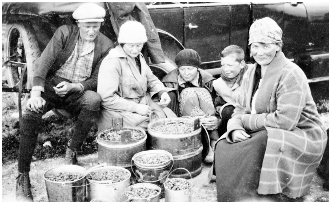
Økt tilgang på personbiler gjorde at hele familien bidro i bærplukkingen. Bildet er tatt i 1927 i Øversjødalen, Tolga.

Normen om at en ikke skulle plukke umodne molter ble til slutt en lovbestemmelse. En mangeårig diskusjon med ulike forslag skapte en lovendring. Organisasjoner, allmenningssyrer, småbrukerlag, bærlag, ulike fora for skogbruk, landbruksselskapene, enkeltpersoner, fylkesmenn og andre organisasjoner var alle aktører som bidro i den offisielle debatten, og de var med på å påvirke prosessen slik at den uformelle normen ble gjeldende lov. Debatten ble delvis referert i avisene, noe som avisene viser med blant annet detaljerte referater fra herredstyremøter og avisinnlegg. En god del dialog skjedde også direkte med Landbruksdepartementet. Oversikt over departementets arbeid med saken kan være gjenstand for videre studier av saken.