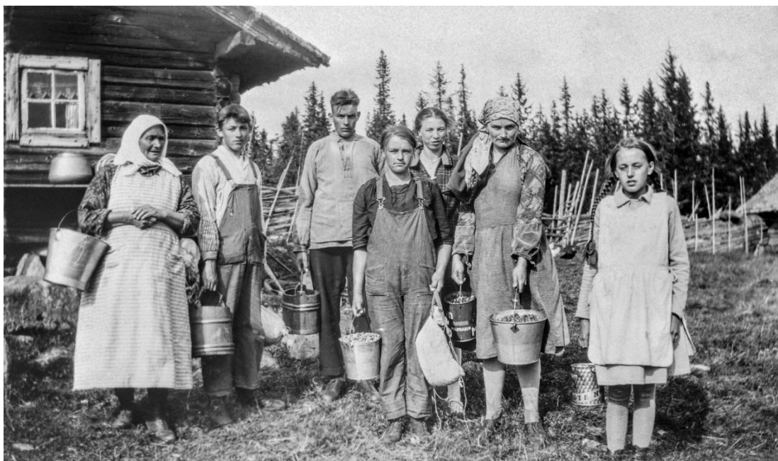
I Løten kommune var det mange som skaffet seg en nødvendig ekstrainntekt gjennom bærplukkingen. Bildet viser molteplukkere ved Savalsetra i Løten.

Løten kommune er i mange sammenhenger blitt brukt som et eksempel hvor bærplukking for salg var en utbredt aktivitet i hele kommunen. Bærplukking var en kjærkommen inntektskilde for dem som ellers hadde vanskeligheter med å finne seg annet arbeid (Binæringernes arbeidskomité, 1909). Mangesysleri var nødvendig for å få de økonomiske endene til å møtes. Derfor dro hele familier til skogs eller fjells for å sanke bær. Barna som bidro i arbeidet fikk muligheten til å tjene penger selv (Skjærbakken, 2001, s. 33). Mange familier var avhengig av en husholdsøkonomi hvor alle familiemedlemmene bidro på en best mulig måte for å sikre egen overlevelse (Østlendingen, 1909). En lokalkjent mann fra bygda sa det slik: « Resultatet av denne arbeidsomhet i innsamling av bær er at «yderst fattigdom praktisk talt ikke forekommer i bygden» » (Binæringernes arbeidskomité, 1909). Det kan se ut til at det var en sammenheng mellom antall sysselsatte i bærplukking og tilgangen på annet arbeid (Hamar stiftstidende, 1935). En god bærseong ga gjerne positive utslag på statistikken for arbeidsledighet (Østlendingen, 1933b). Likevel kunne ikke bærplukking måle seg med annet lønnet arbeid inntektsmessig (Hamar arbeiderblad, 1935a).