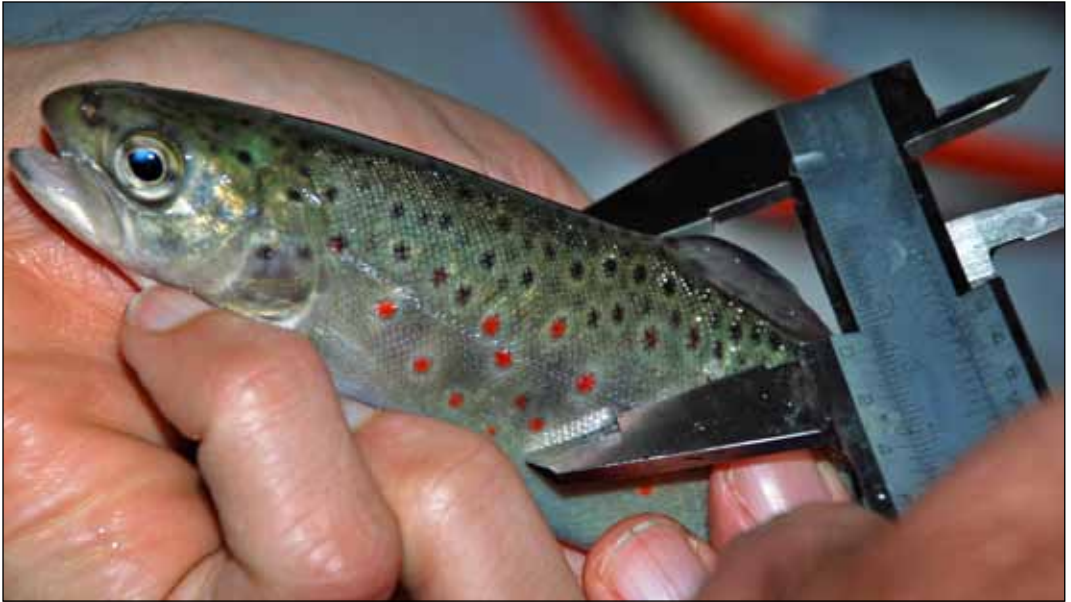
Bilde 2. Måling av bredde over ryggen på ørretunge.