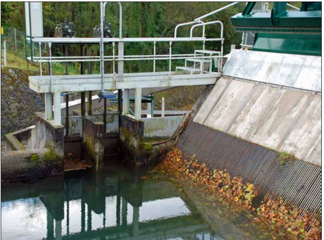
Bilde 3. Eksempel på en skråstilt og finnmasket varegrind med små lysåpninger ved et elvekraftverk i Gave d'Ossau i Syd-Frankrike. En alternativ nedvandringsvei for fisk er etablert nært inntil varegrinda.