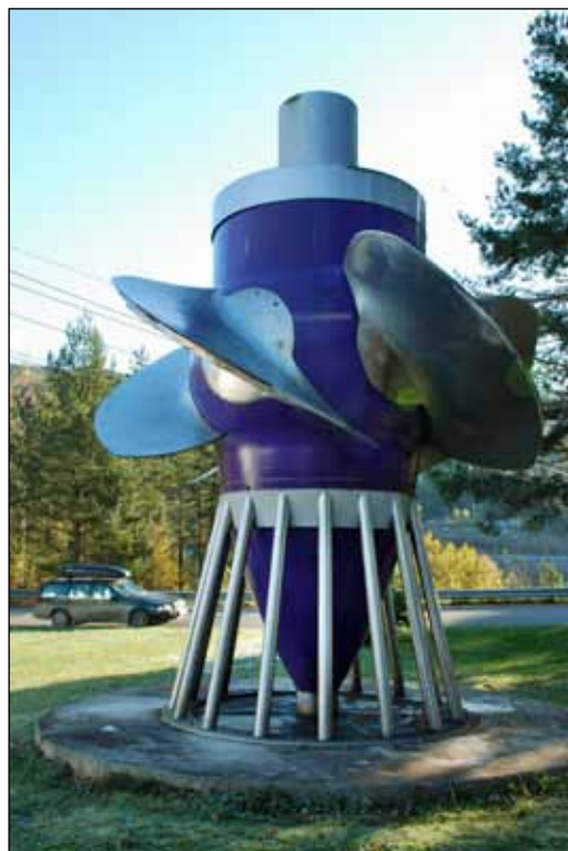
Bilde 1. Stor Kaplan-turbin fra Hunderfossen kraftverk i Gudbrandsdalslågen. Lang avstand mellom rotorbladene gir relativt lav dødelighet for fisk som passerer turbinen.

Dødeligheten som oppstår når fisk passerer begge disse turbintypene er relatert til fiskens lengde og en rekke tekniske detaljer i selve turbinene. Dimensjoneringen av turbinene, rotasjonshastighet, avstand mellom turbinbladene, raske trykkøkninger på vei inn i turbinene, gassovermetning og kavitasjoner på vei ut av turbinene utgjør årsakene til akutt dødelighet hos fisk. Direkte dødelighet oppstår som følge av mekanisk skade ved kontakt med rotor og stator