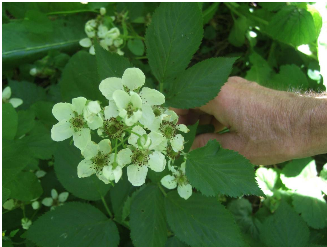
Figur 3 Alleghenbjørnebær Rubus allegheniensis i blomst i Vestre Akerskogen. Foto: A. Ofte, 25. juni 2010.

Hele 22 av de forvillede artene er busker og trær. Sammen med 15 arter av naturlige vedplanter gav dette totalt 37 forskjellige busker og trær på det lille friområdet. Dette er et svært høyt antall for et såpass lite område. Av de forvillede artene er den lille forekomsten av alleghenbjørnebær Rubus allegheniensis ( figur 3 ) mest spesiell. Det var én forekomst i øvre del, ca 8 m nedenfor gjerdet i øvre kant av området, ca 10 m vest for gangveien gjennom området. Den