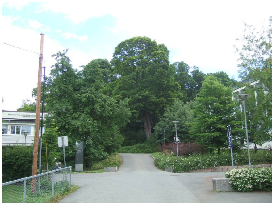
Figur 3 Edellauvskogen med et av de store eiketrærne i forgrunnen, nord for Blindernveien. Foto: A. Oftin, 25. juni 2010.