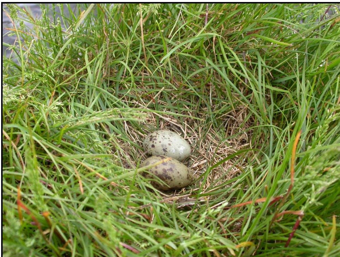
Figur 4: Reir til makrellterne på en av de minste holmene i 2007.