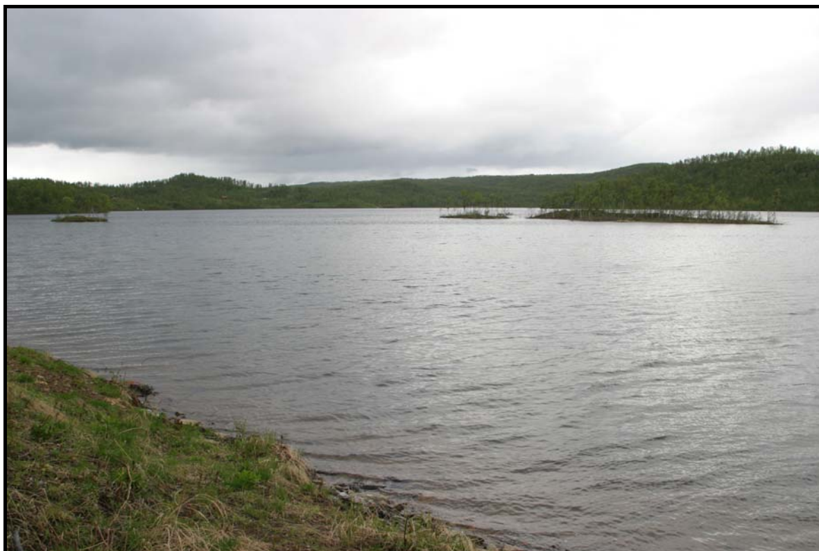
Figur 1: Utsnitt over sørenden av Vegavatn, hvor holmene og utløpet ligger.