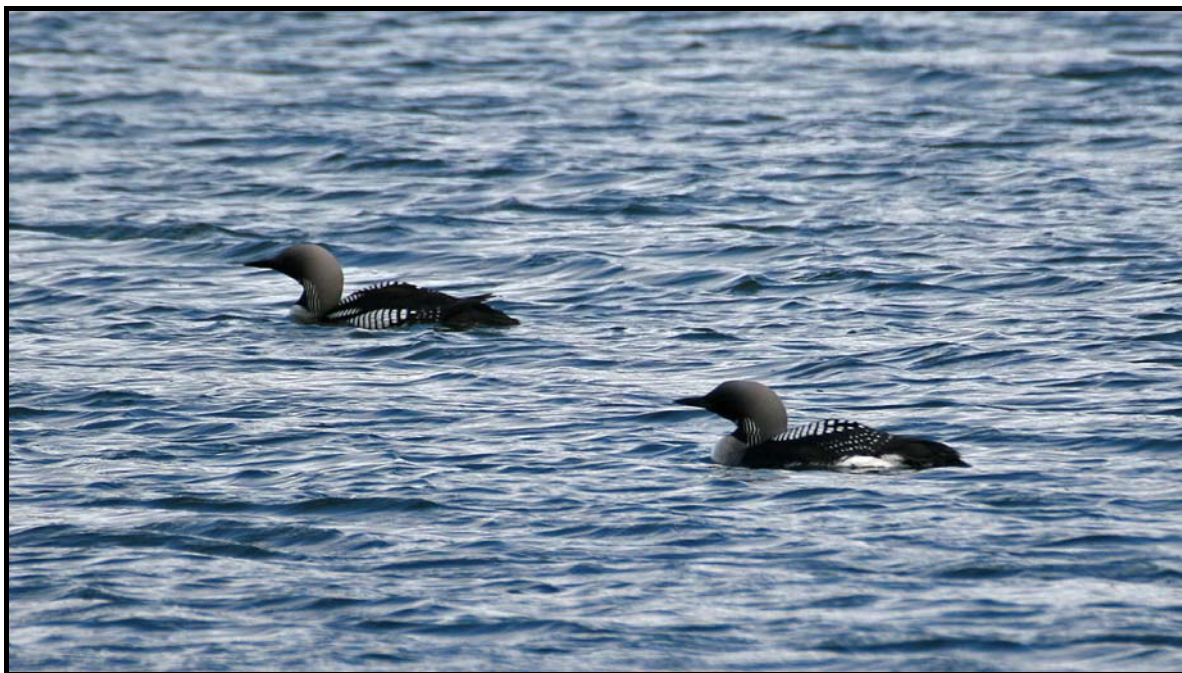
Figur 3: Det hekker et par sturlom i Vegavatn.