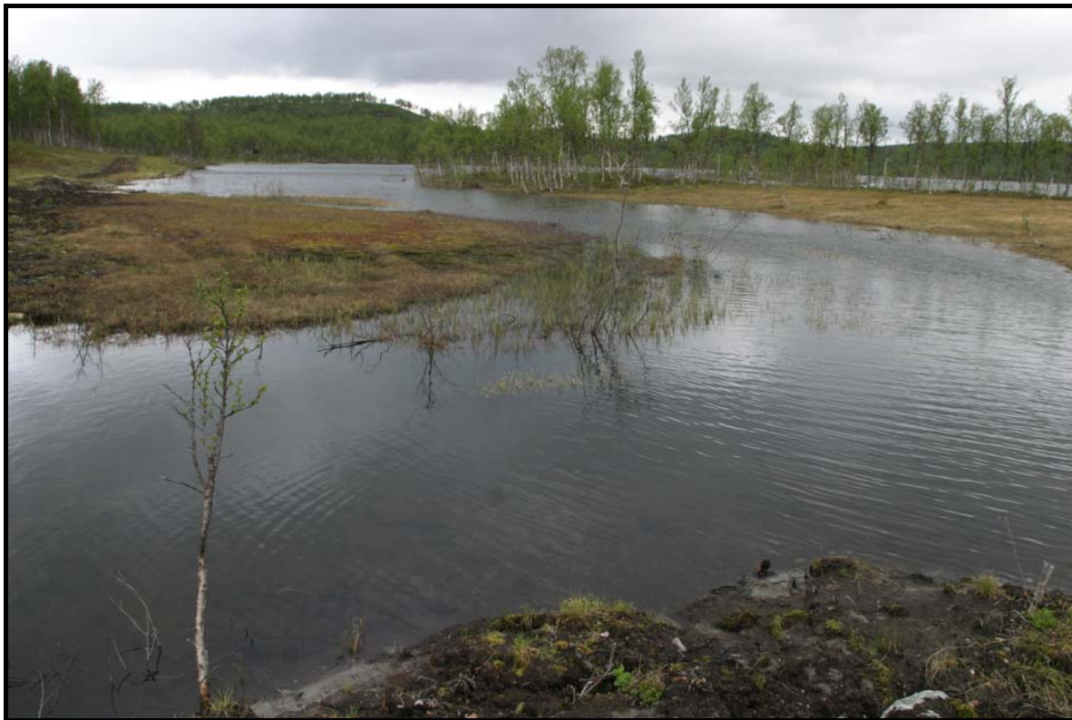
Figur 2: Utløpet av Vegavatn

Det ble registrert 10 våtmarksfugler under de to befaringene på Vegavatn. Av disse var det storlom (sårbar) og makrellterne (sårbar) som er på den norske rødlista. I tillegg ble det registrert hekkende horndykker (direkte truet) her på slutten av 1980-tallet (J. Gunnberg pers. medd.). Vegavatn er gitt en samlet viltvekt på 3, noe som tilsier regional verdi . Dette er i stor grad på grunn av områdets funksjon som hekkelokalitet for storlom (se forøvrig vedlegg 1).