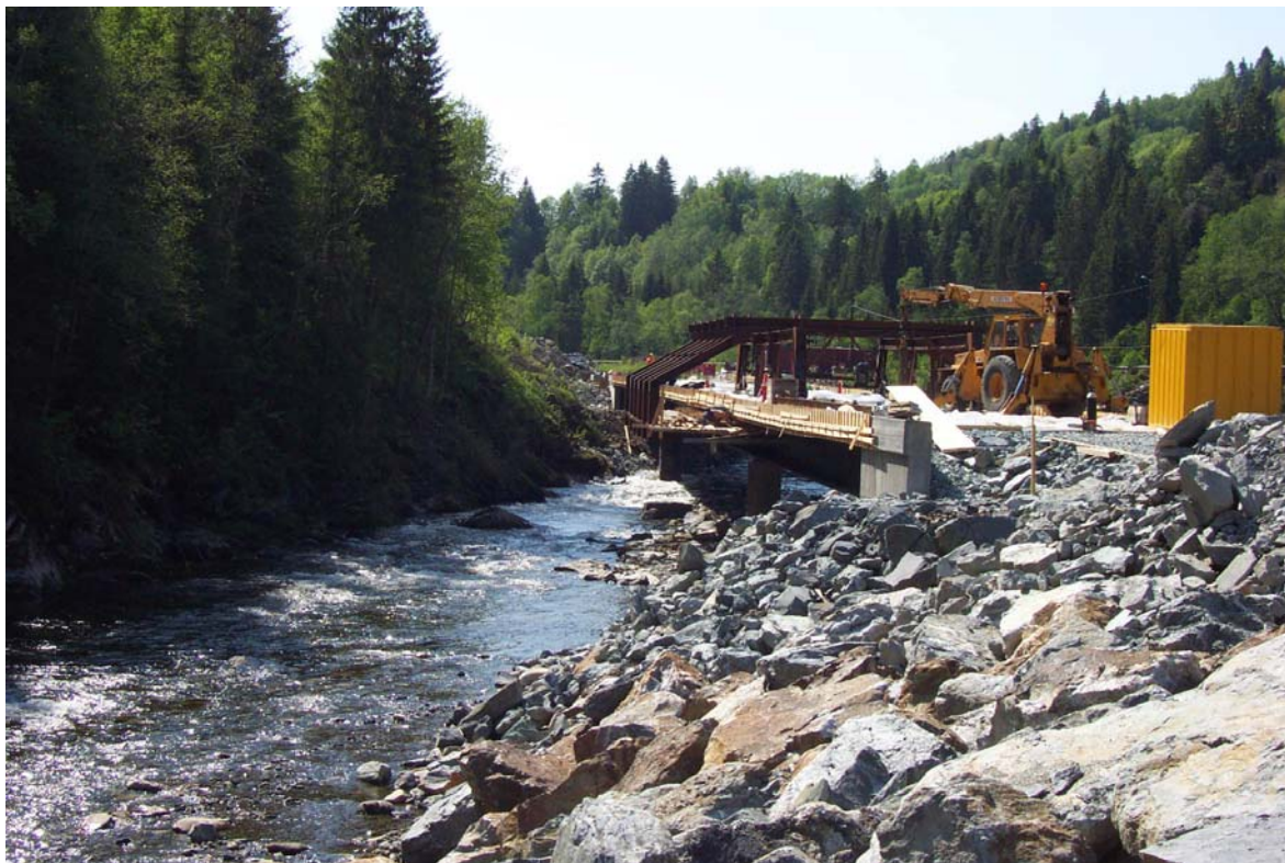
Bilde: En viktig rolle for kommunen er å ivareta lakeinteressene i utbyggingssaker.