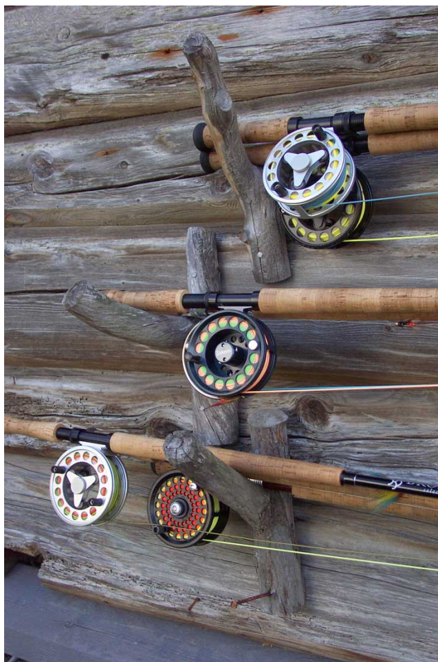
Bilde: Utvikling av fisketurisme og tilrettelegging for fritidsfiske har vært viktige mål for driftsplanprosjektet.

Direktoratet for naturforvaltning (DN) engasjerte NINA til å evaluere siste fase i omleggingen til en lokal og driftsplanbasert lakseforvaltning, dvs. delprosessen for laks. Oppgavene i denne siste evalueringen har bestått av å vurdere den samlede måloppnåelsen for prosjektets hovedmål og delmål. I forrige evaluering ble det også gitt en foreløpig vurdering av måloppnåelse for delmålene, sammen med en vurdering av prosjektets arbeidsmål (Dervo 2002).