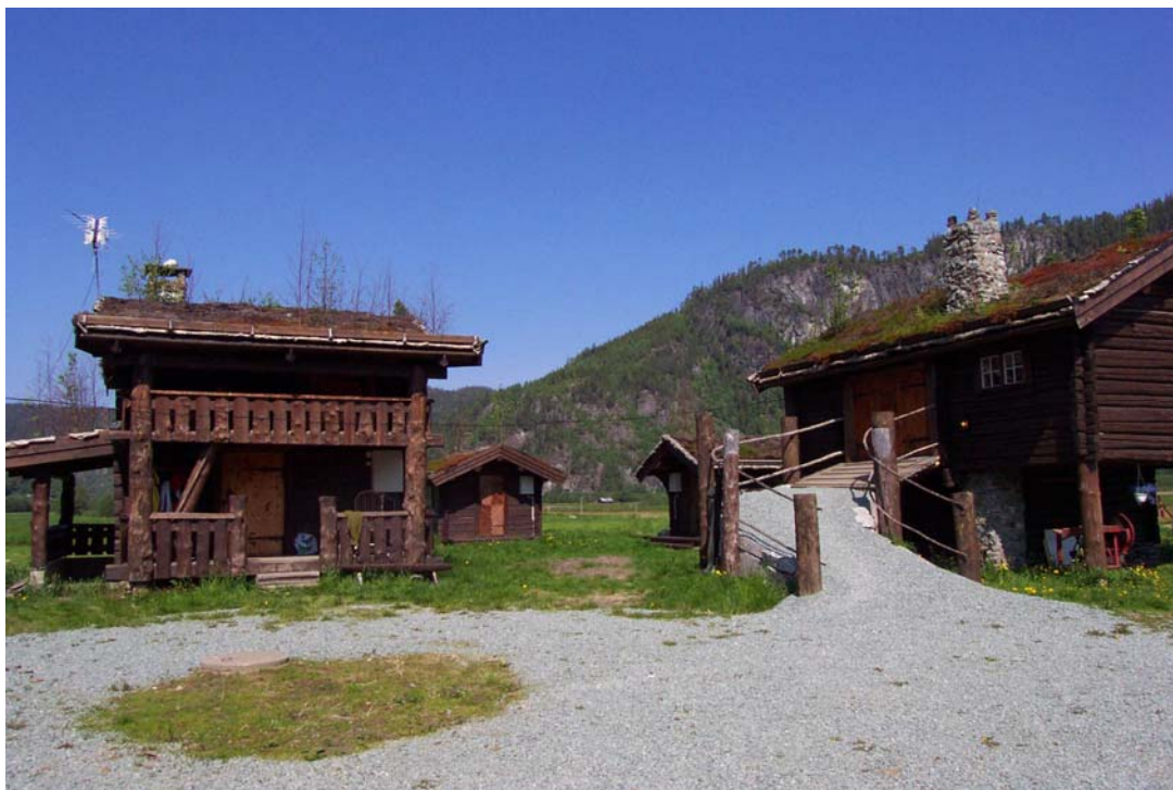
Bilde: Tilrettelegging for fisketurisme er en viktig del av den lokale forvaltningen.