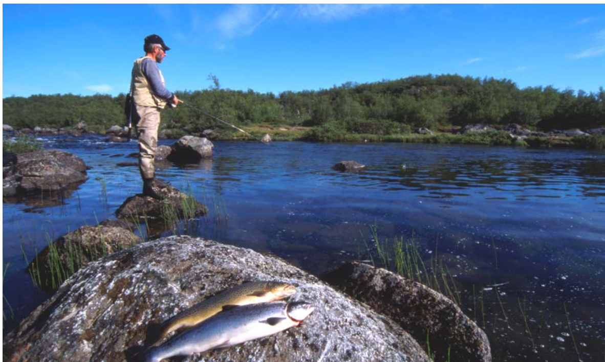
Bilde: Det er en liten overvekt av både elveeierlagene og JFF som mener at fisketilbudet har blitt bedre med driftsplaner.

Også for JFF tyder svarene på at det ikke er mange negative erfaringer med driftsplaner. Snarere tvert i mot er det flere foreninger som støtter positive påstander om erfaringene med driftsplaner, enn negative. Selv om det er mange foreninger som er positive, er det en liten andel, både blant elveeierlagene og JFF, som har "svært dårlige" erfaringer med den nye forvaltningsmodellen. Dette er det viktig å gripe fatt i.