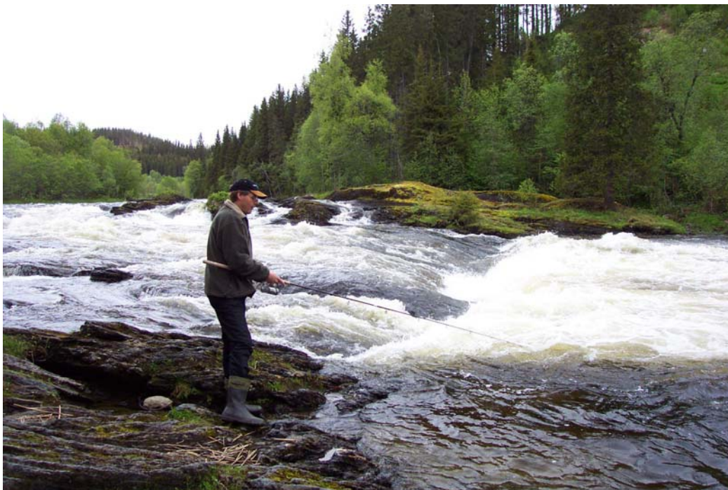
Bilde: Høylandsvassdraget, et sidevassdrag i Namsenvassdraget med egen driftsplan.

Samlet ble det i 2005 registrert 215 planer i 207 vassdrag med anadrome laksefisk. Av disse var 170 oppført i lakseregisteret per 1.1.06. I 6 vassdrag var det mer enn en plan, for eksempel i både hovedvassdraget og i et sidevassdrag. Oversikten omfatter påbegynte og ferdigstilte driftsplaner. Det er talt opp både planer som er biologiske og som inneholder alle de tre typene delplaner;ologi, næring og økonomi.