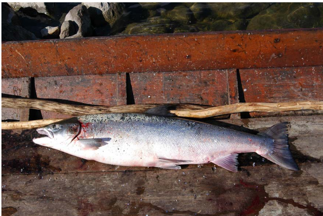
Bilde: En Tanalaks på 10 kg.

Til tross for enkelte misforståelser er det mange av både elveeierlagene, JFF og kommunene som oppgir at de deltar i lokale og eller regionale fagråd ol. Det virker som om samarbeidsrådene er viktigst for de aktørene som er engasjert i vassdrag uten velfungerende driftsplaner. Generelt ser det ut for at fagrådene som ble opprettet i mange vassdrag har fått mindre betydning nå, enn hva som var tilfelle i første fase av driftsplanarbeidet, dvs. i perioden 1996 – 2000. Svarene fra de ulike aktørene tyder på at driftsplanprosessene, og de nettverkene som etableres i lys av dette, har tatt over funksjonen til mange av fagrådene. Samtidig er det opprettet enkelte mer lokalt pregede samarbeidsråd. På Vestlandet er imidlertid de tradisjonelle fagrådene fortsatt i funksjon. Spesielt fylkesmennene understreker at de har hatt gode erfaringer med disse. Vi har ikke gått nærmere inn på dette temaet fordi dette ble grundig beskrevet i første fase av prosjektet (Dervo 2002).