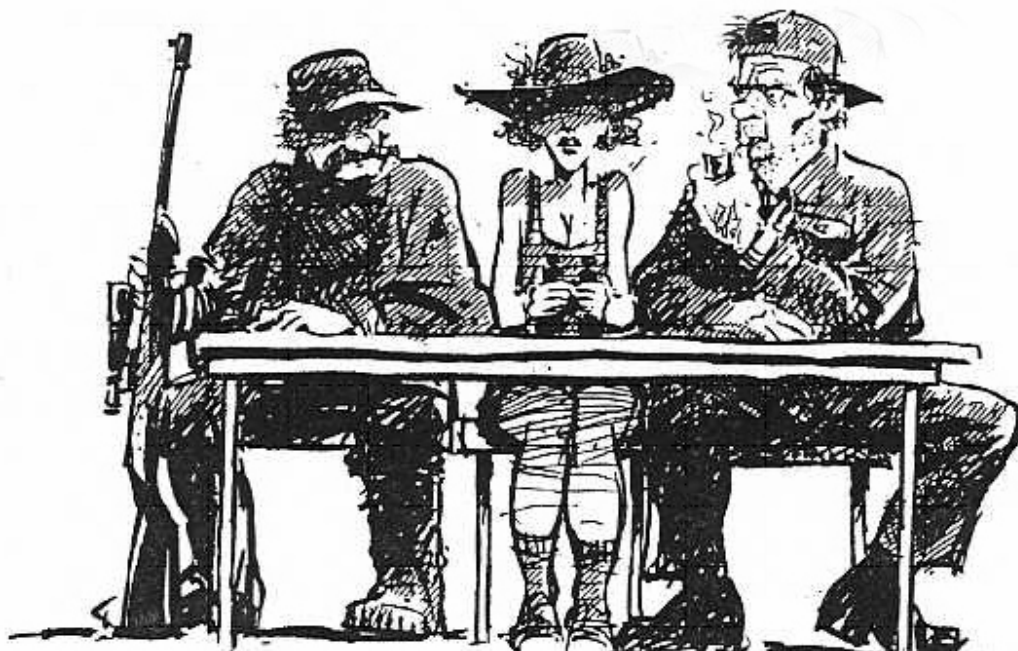
Figur 3: Lokal utmarksforvaltning domineres gjerne av menn. Tegning: Oscar Jansen. Kilde: Storaas et al. 1996, s 63.

Mannsdominans i utmarksforvaltningen kan i et likestillingsperspektiv betraktes som urettferdig, og som en konsekvens av dette kan beslutninger som tas anses som illegitime. En annen konsekvens er at kvinners ressurser ikke utnyttes innen utmarksnæringene. Kvinner kan bringe inn nye ideer til hvordan en kan utnytte utmarka, men slik ideer går en glipp av som en følge av kvinneunderskudd i relevante råd og utvalg. Sist, men ikke minst, vil kvinner ikke kunne fremme sine interesser innen dette feltet i det offentlige rom. Som vår informant er inne på, har menn sterke interesser i utmarka. Disse interessene kan ikke betraktes som uttrykk for allmenninteresser så lenge halvparten av befolkningen ikke deltar i forvaltningen. Menns interesser kan stå i motstrid til kvinners interesser. Demokratisk underskudd er, sammen med underutnyttelse av ressurser, konsekvenser av mannsdominans i utmarksforvaltningen.