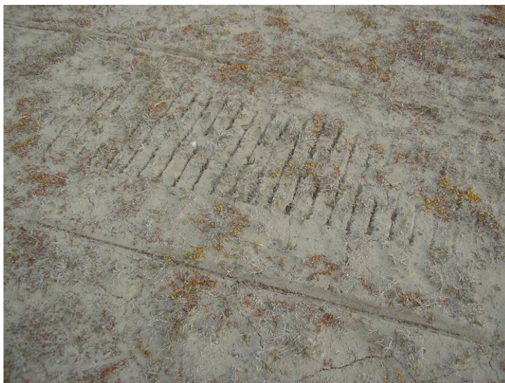
Her er skutersesongen forlenga til etter snøsmelting.

Det finst ikkje systematiske studier frå Norge som viser effektar av vinterkjøring for framsmeltningstidspunkt, vassinnhald, temperaturtilhøve i jorda eller effektar på vegetasjon, men det var gjennomført ein relevant studie i Sverige på 1970 talet (Kjellin 1977). Kjøring på vinterføre kan gje mekaniske skader på dvergbjærk og vier i lynghei og dvergbjærkhei, primært som resultat av den direkte kontakten mellom skuter og buskene. Skadene oppstår gjerne i samband enkeltkjøringar tidleg i sesongen når det er lite snø. Vedvarande kjøring utover sesongen forverrar ikkje denne effekten i særleg grad. Det er ikkje påvist mekaniske skader av vinterkjøring på grasmyr, truleg fordi myra er beskytta av ei iskappe. Det er ein tendens til at vedvarande kjøring gir auka negativ effekt på feltsjiktet, både ved sommar- og vinterkjøring. Det er ikkje muleg å foreslå ei minimum snødjubde for å tillate kjøring som tiltak for å unngå skader, ettersom strukturen på snøen er avgjerande for effekten av kjøringa.