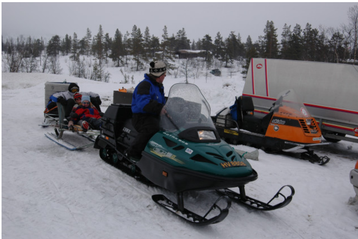
Skutertransport fram til hytta er ei særleg aktuelle problemstilling.

Når det gjeld eventuell liberalisering av norske reglar og forskrifter om motorferdsel i utmark, så syner haldningsundersøkingar at det er ønskje om å halde strenge reglar for barmarkskøyning, også i meir "motorliberale" strøk av landet. Når det gjeld bruk av snøskuter så er det sprikande resultat, både mellom regionar, og innan den enkelte region, avhengig av kva transport- eller køyreformål det er snakk om. Resultata tyder på at særleg ønsket om transport til hytta kjem sterkare opp, saman med ønsket om eigne rekreasjonsløyper. Dette bør utløyse ein klar strategi og ei presisering av reglane om transport fram til hytte (inkludert leigekøyning). Dessutan bør ein ha vurdert alternativet med vinterbrøytt vegar fram til hytter og hyttefelt – kva er minst ønskjeleg, skuter eller veg? I eit tid med auka krav til standard, service og lett tilkomst kan fort dette vere alternativa, og ikkje valet mellom skuter og ski.