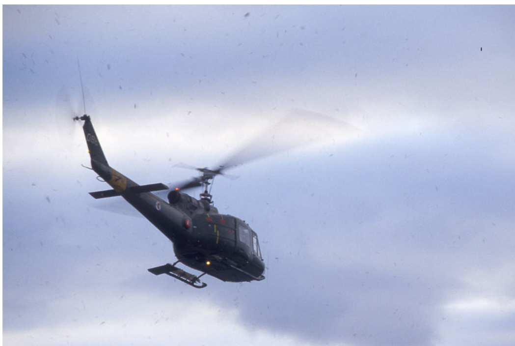
Luftfartøy, eller fartøy i lufta, ser ut til å gi særleg sterke effekter på dyr.

Påvirkningene fra kjøretøyet i seg sjøl kan være ulikt mellom ulike typer kjøretøy. Studier har fokusert på først og fremst bruken av kjøretøyene, både når det gjelder snøskuter og helikopter. Sannsynligvis er dette mest riktig, ut fra at vi vet at dyr reagerer på aktivitet heller enn konstruksjoner (Andersen et al. 1996, Rodgers and Smith 1995). Men om dette gjelder alle dyr, vet vi ikke sikkert. Og noen dyrearter kan antakelig også registrere hva som forårsaker aktiviteten (altså kjøretøyet).