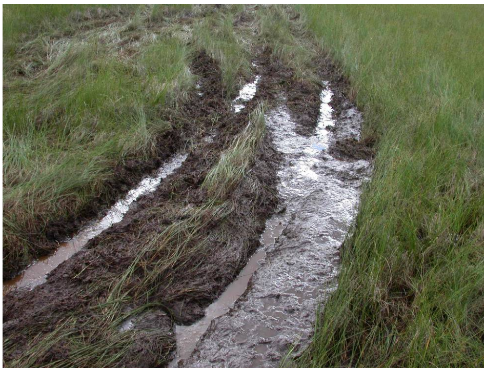
I blaut myr kan ein passasje være nok til at det oppstår skade på vegetasjon og endra dreneringsmønster.

Det er påvist nær samanheng mellom skadeomfang og bæreevnen til underlaget. Vassinnhaldet i jorda er den viktigaste enkeltfaktoren som påverkar bæreevna, og deretter kjem innhaldet av finstoff (leir og silt) i lausmassane. Dette betyr at slitestyrken er dårlegast på myr og torvdekt mark og våte massar med høgt innhald av finstoff (Tømmervik et al. 2005). Ulike jordtypar har ulik sårbarheit, på same måte som ulike vegetasjonstypar har det. Dvs. jordartane tåler ulik grad av påverknad før dei blir påverka og tek til å erodere. Effekten må oftast sjåast i samanheng med terrengform og hellingsgrad. Generelt er finkorna substrat mindre stabile enn grovkorna. I grove substrat kan det lett bli avsett spor i overflata, men mangel på finstoff gjer at det i liten grad foregår erosjon utanfor sjølve kjøresporet (Elvebakk & Sørbel 1988).