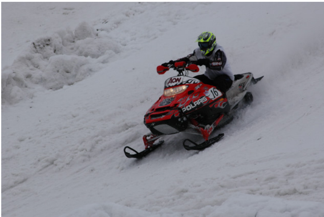
Ulike verdisyn kan skape eigne verdikonflikter omkring utmarksbruk.

Den andre konfliktmodellen – den normative modellen – dreiar seg om konflikter der ulike brukargrupper har ulike normer (sosiale verdiar ), uavhengig av om gruppene møtest i terreng-et eller blir konfrontert med kvarandre. Normer er klare vurderingar (standarar) for kva ein rek- nar som akseptabel eller uakseptable åtfærd eller bruk av bestemte område. Vaske et al. (2004) har t.d. undersøkt sosiale verdiar blant skigåarar og snøbrettkøyrarar, og tidlegare (Vaske et al. 1995) blant jegerar og ikkje-jegerar. Vaske et al. (1995) omtalar denne " social values "-tilnærminga (på gruppenivå) som ein annan kategori konflikt enn det dei kallar " interpersonal conflict " (som nok berre er eit anna namn på den kognitive konfliktmodellen (målkonfliktmodellen)).