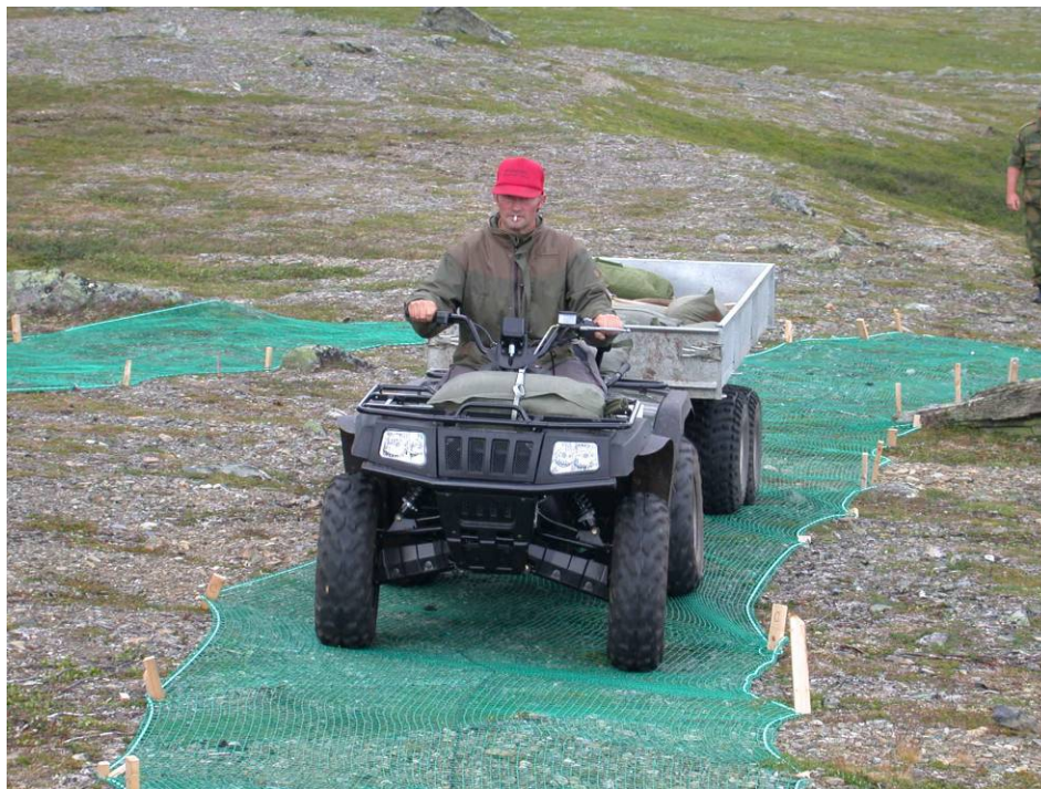
Det er gjennomført noen vellykka forsøk i Troms på kanalisering av ferdsel og forsterking av kjøretrasèar ved bruk av geo-nett og trålpopenett.