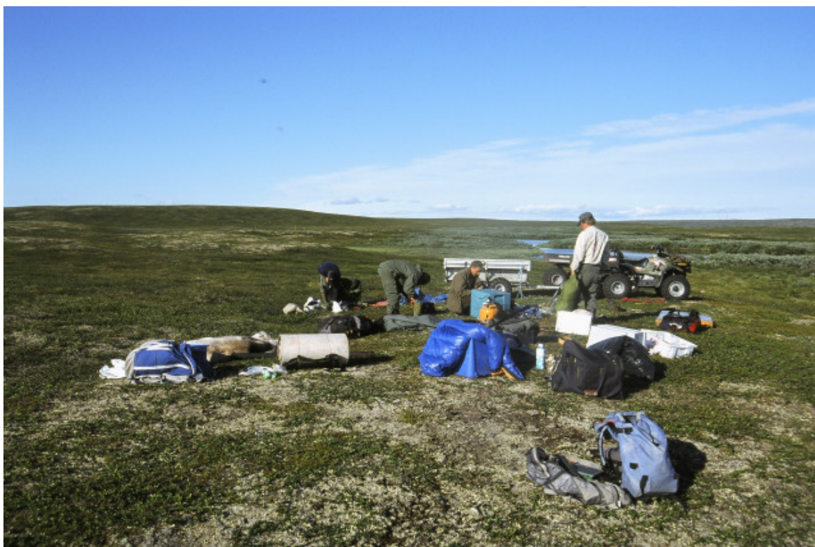
Menneskene på eller rundt kjøretøyet kan ha sterkere effekt enn kjøretøyet i seg selv.

Effekter på vegetasjon vil ha indirekte påvirkning på dyrelivet i et område. Sammenhengene kan være komplekse og kan være sterkt påvirket av lokale forhold, både vegetasjon og topografi. Generelt er skadet vegetasjon av dårligere verdi for dyreliv enn intakt vegetasjon.