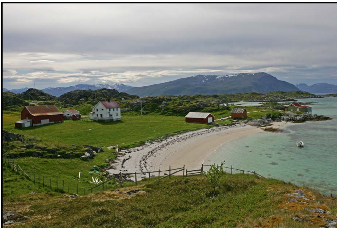
Figur 6: Gården Måsvik.

Transportstrekningen frem til planområdet blir omtrent 8 kilometer fra Hamnes eller under 1 kilometer fra dampskipskaia. Det antas at hver turbin vil kreve 10 – 12 turer. I tillegg kommer massetransport og transport av betong. For hvert turbinfundament forventes et betongforbruk på omtrent 100 m 3 for turbiner plassert på fjell. Dette innebærer totalt et sted mellom 300 og 500 m 3 svarende til 40-70 billass. Masser tatt ut i skjæringer og i tilknytning til fundamentering vil i størst mulig grad bli anvendt som fyllmasser i prosjektet.