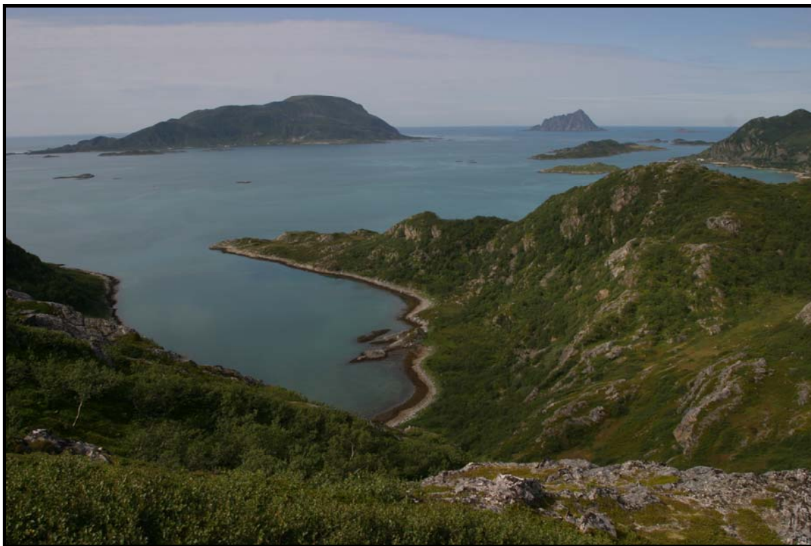
Figur 2: Hølkefjorden ligger like nord for avgrensningen av planområdet, men innenfor influensområdet.. Sandøya og Sør-Fugløya ses i bakgrunnen.

Planområdet for vindparken ved Måsvik er avgrenset mot nord av Hølkefjordvatnet og mot nordøst av eiendomsgrenser, og for øvrig i hovedsak avgrenset av høydekote 50 (se pkt 2.3). Influensområdet er noe større og inkluderer områdene sør for Hølkefjordneset og Hølkefjordvatnet, samt de lavereliggende områdene.