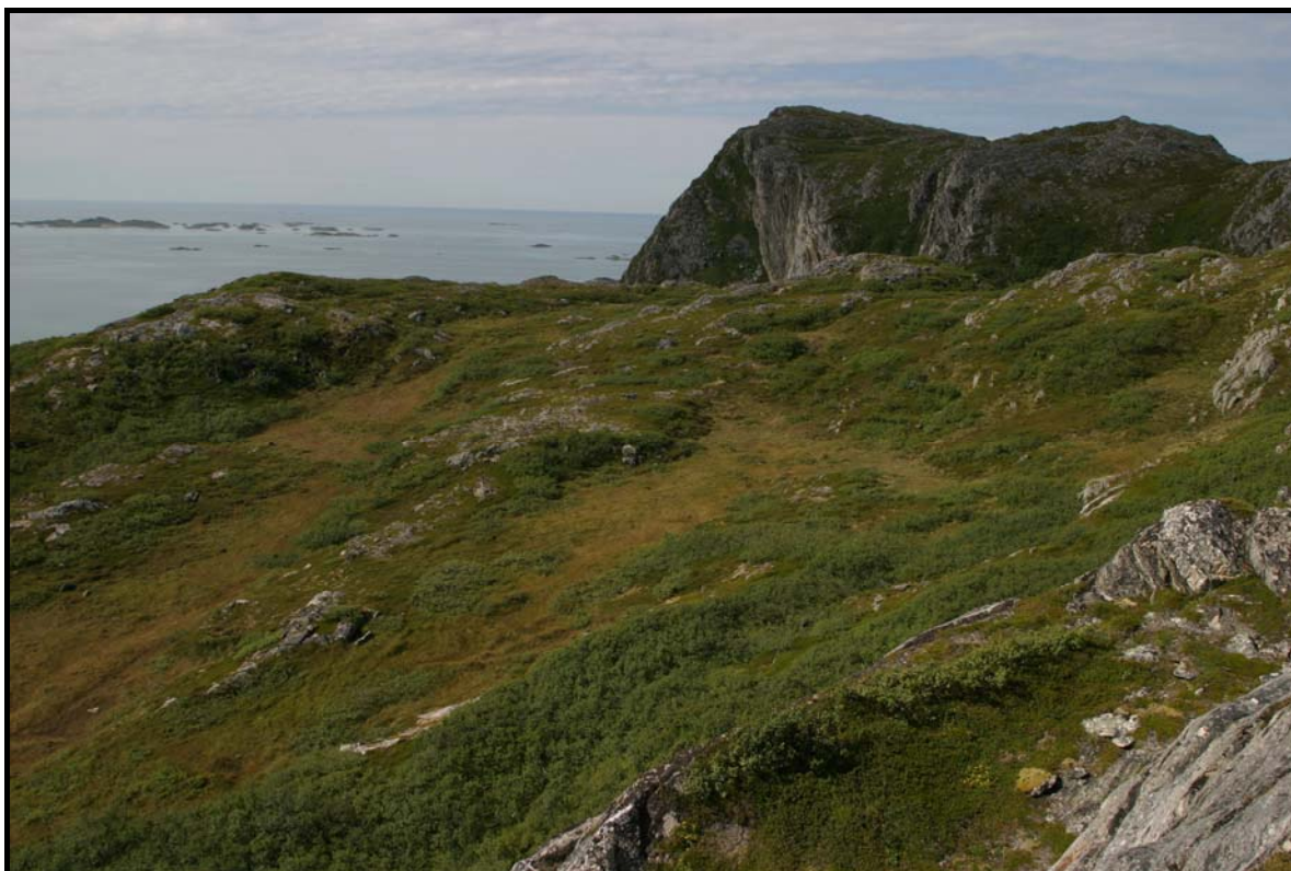
Figur 8: Forrabalten.