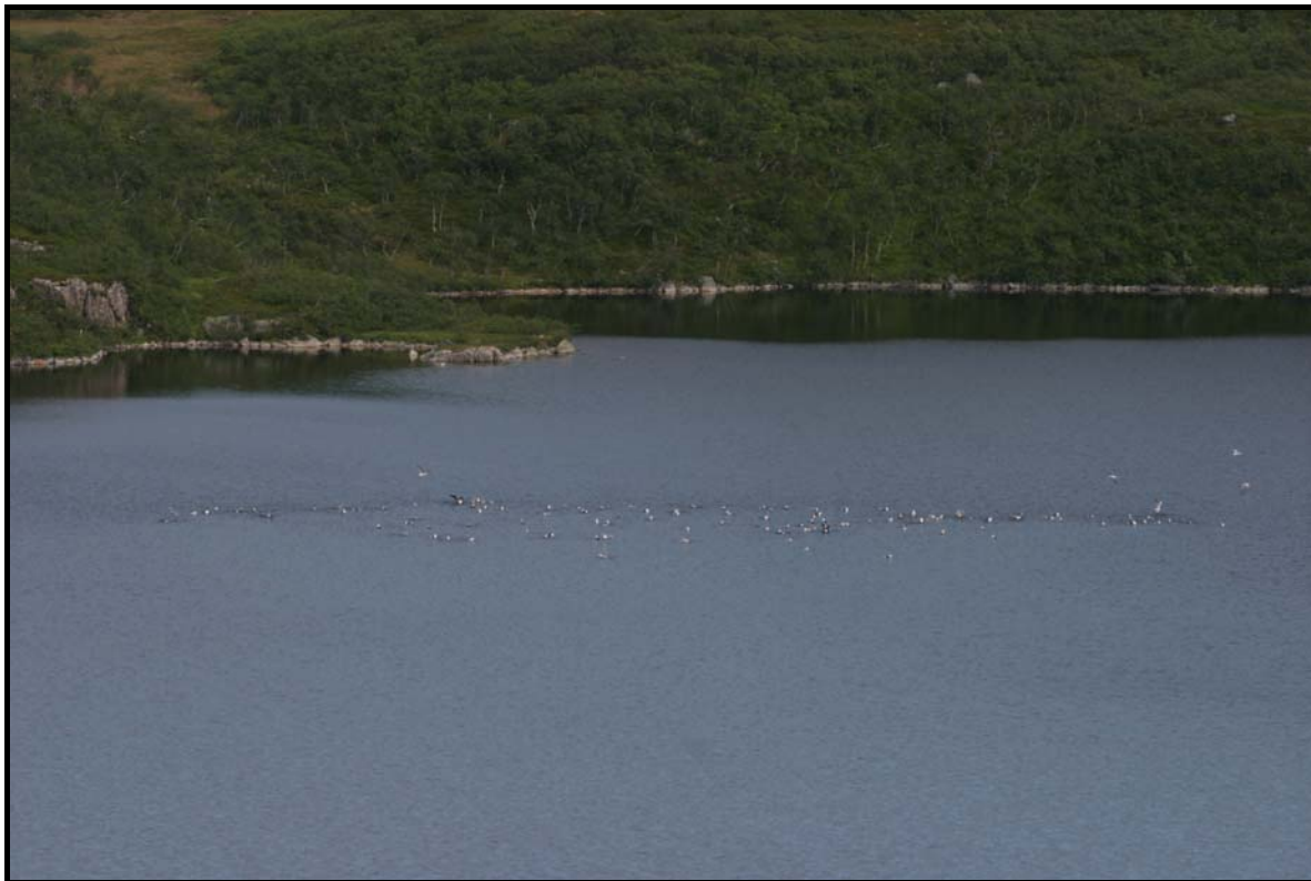
Figur 7: Hølkefjordvatnet fungerer som vaskeplass for måsefugler.

det sannsynligvis både hare, røyskatt og flere smågnagerarter i området, en antagelse vi delvis baserer på generell kjennskap til slike habitater regionen.