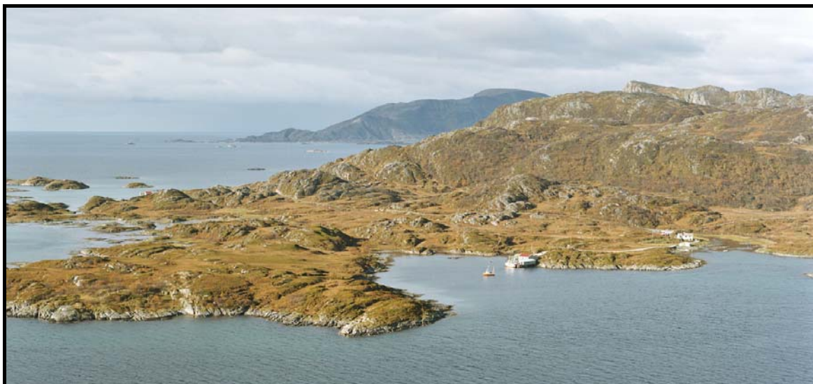
Figur 3: Bildet viser sørlige deler av planområdet sett fra øst/sørøst.