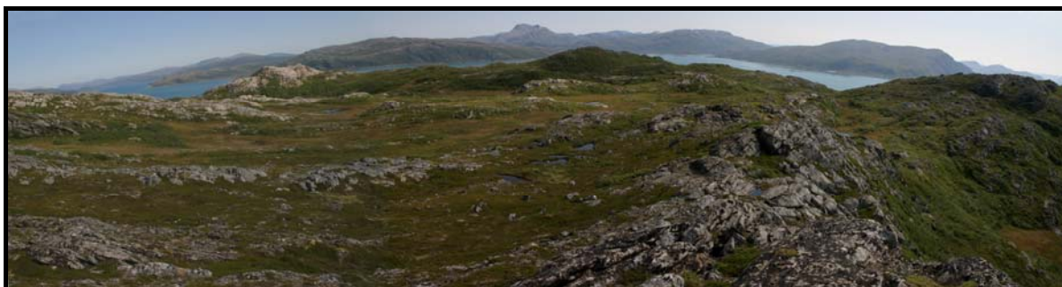
Figur 5: Panoramabilde tatt sørøstover fra Sjetlevikfjellet. Skardsfjorden på Ringvassøya i bakgrunnen.