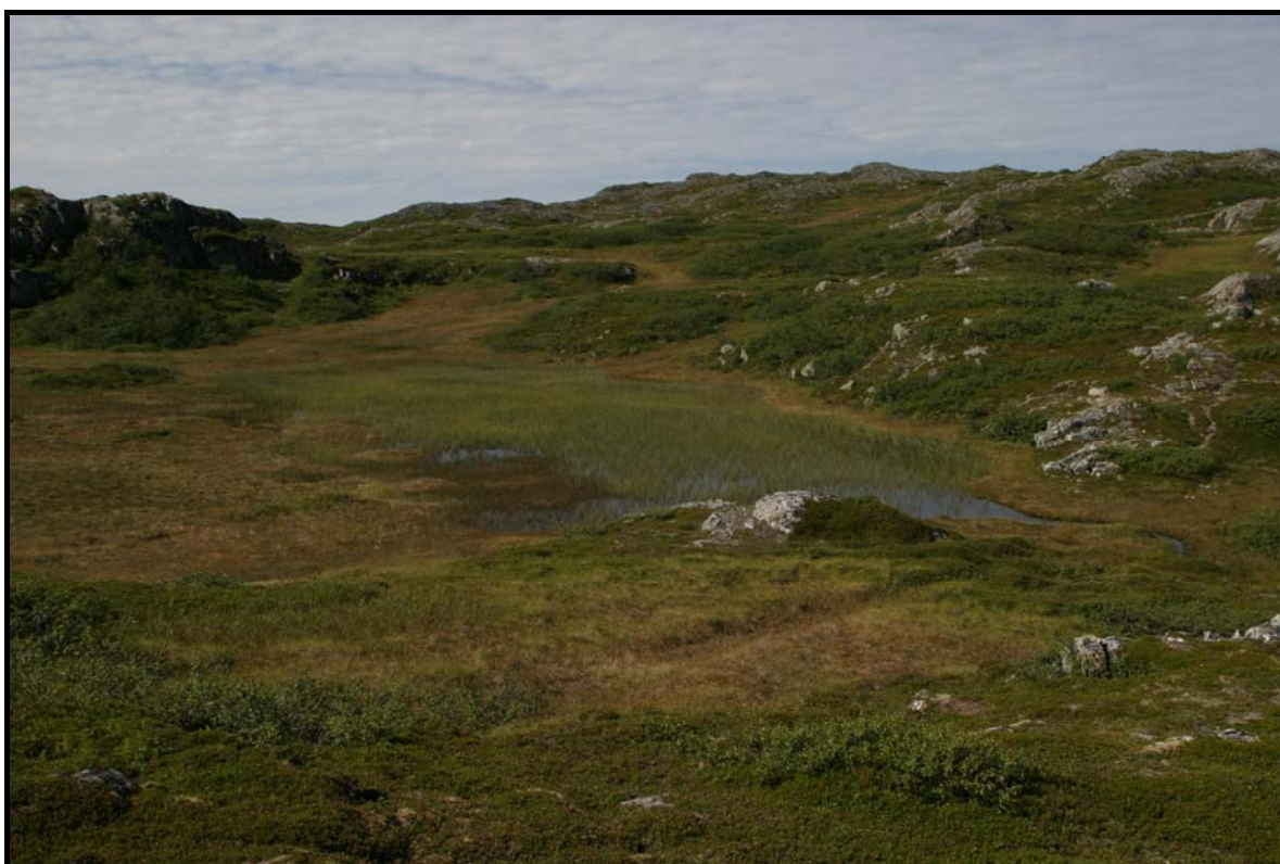
Figur 9: Svartsteinmyran.