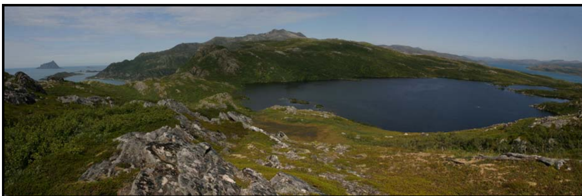
Figur 4: Panoramabilde av Hølkfjordvatnet.. Sør-Fugløya til venstre i bildet og Skagøysundet til høyre.